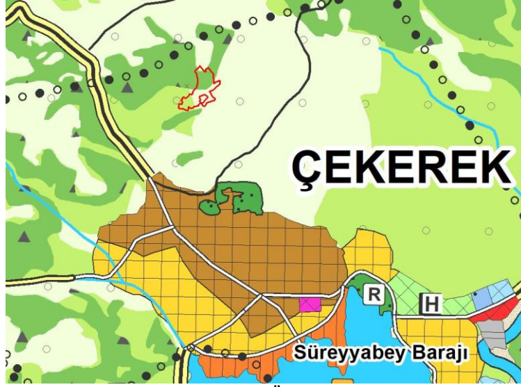
Şekil 3: Planlama Alanının 1/100.000 Ölçekli Çevre Düzeni Planındaki Yeri