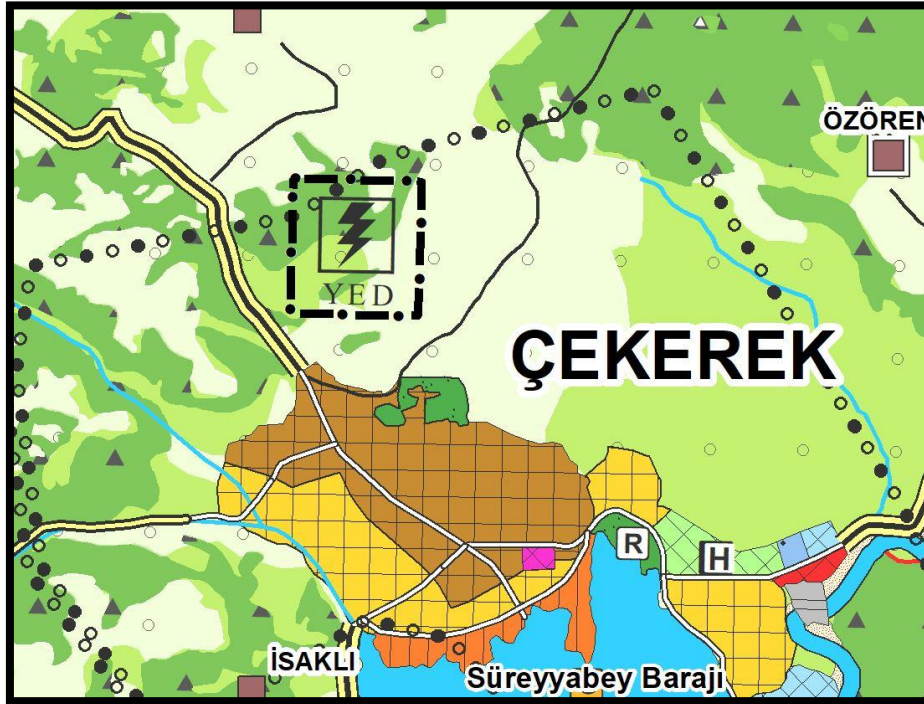
Şekil 9: Yozgat-Sivas-Kayseri Planlama Bölgesi 1/100.000 Ölçekli Çevre Düzeni Planı Değişikliği

Yapılan değerlendirmeler sonucunda; 14.06.2014 tarihli Mekânsal Planlar Yapım Yönetmeliği hükümleri çerçevesinde; Yozgat-Sivas-Kayseri Planlama Bölgesi 1/100.000 Ölçekli Çevre Düzeni Planının 8.19.5 plan hükmü uyarınca Yozgat İli, Çekerek İlçesi, Bağlarbaşı Mahallesi, 454 ada 83,85,87,88,90,92,93,94,95,96,98,99,100,101,157,158,163,164 ve 177 nolu parsellerde yaklaşık 15,6 hektar alanda Mor Yatırım Enerji Sanayi ve Ticaret A.Ş. tarafından gerçekleştirilmesi planlanan "Zile GES ve Elektrik Depolama Tesisi (13 MWm/10 MWe)" için Yozgat-Sivas-Kayseri Planlama Bölgesi 1/100.000 Ölçekli Çevre Düzeni Planının H34 nolu paftasında "Tarım Alanı", "Çayır-Mera" ve "Orman Alanı" kullanımı üzerine "Yenilenebilir Enerji Üretim Alanı" gösterilmesine yönelik düzenleme yapılmıştır.