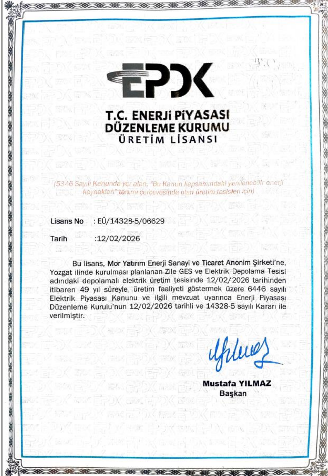
Şekil 8: EPDK Önlisans Belgesi

Kurulması planlanan Zile GES ve Elektrik Depolama Tesisi güneş enerji santral alanı, depolama alanı ve şalt sahasından oluşacak olup T.C. Enerji Piyasası Düzenleme Kurumu tarafından Mor Yatırım Enerji Sanayi ve Ticaret A.Ş. adına 12.02.2026 tarihli EÜ/14328-5/06629 lisans numaralı üretim lisans belgesi düzenlenmiştir.