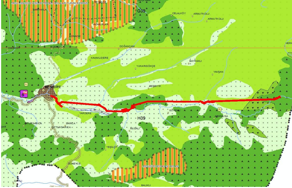
Şekil 2: Plan Değişikliğine Konu Alanın 1/100.000 ölçekli ÇDP'deki Yeri

Plan değişikliğine konu alan; Ordu-Trabzon-Rize-Giresun-Gümüşhane-Artvin Planlama Bölgesi 1/100.000 Ölçekli Çevre Düzeni Planı'nda G-46 Numaralı Plan Paftasında "Orman Alanı" kullanımında yer almaktadır.