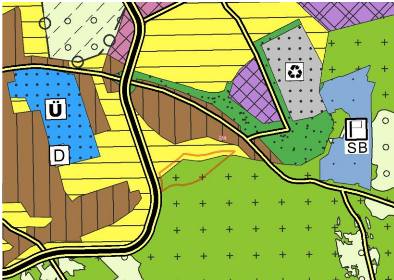
Konya-Karaman Planlama Bölgesi 1/100.000 Ölçekli Çevre Düzeni Planı Mevcut

6306 sayılı Kanun kapsamındaki uygulamalara ilişkin ÇDP'nin 7. Genel Hükümler başlığı altında "7.11. Bu planda kentsel yerleşme alanları içinde kalan ve ..., 6306 sayılı Afet Riski Altındaki Alanların Dönüştürülmesi Hakkında Kanuna tabi alanlara ilişkin uygulamalara ve ... ilişkin başvurular, bu planın koruma, gelişme ve planlama ilkeleri ve nüfus kabulleri ve çevre imar bütünlüğü çerçevesinde ilgili idaresince alt ölçekli planlarda değerlendirilir. Bu doğrultuda hazırlanacak alt ölçekli planlar sayısal ortamda Bakanlığa gönderilir." plan hükmü düzenlenmiştir.