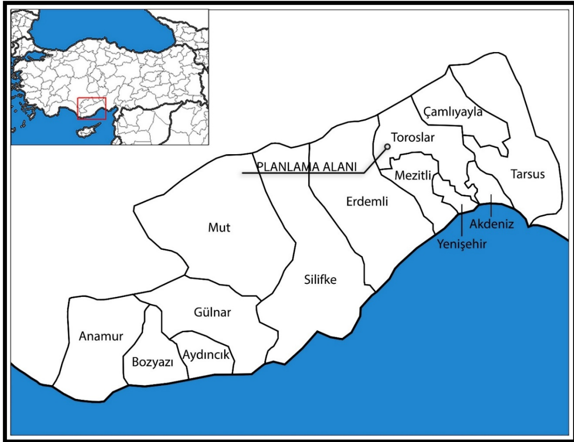
Şekil 1. Planlama Alanının Mersin İlindeki Konumu

Toroslar ilçesinden geçen küçük akarsu ve dereler, yer yer tarımsal alanların sulanmasında önem taşır. İlçenin doğal yapısı hem merkez yerleşiminin hem de yaylacılık kültürünün gelişmesinde önemli rol oynamıştır; özellikle Soğucak, Gözne ve Ayvagediği gibi yaylalar Torosların coğrafi karakterinin belirgin örnekleridir.