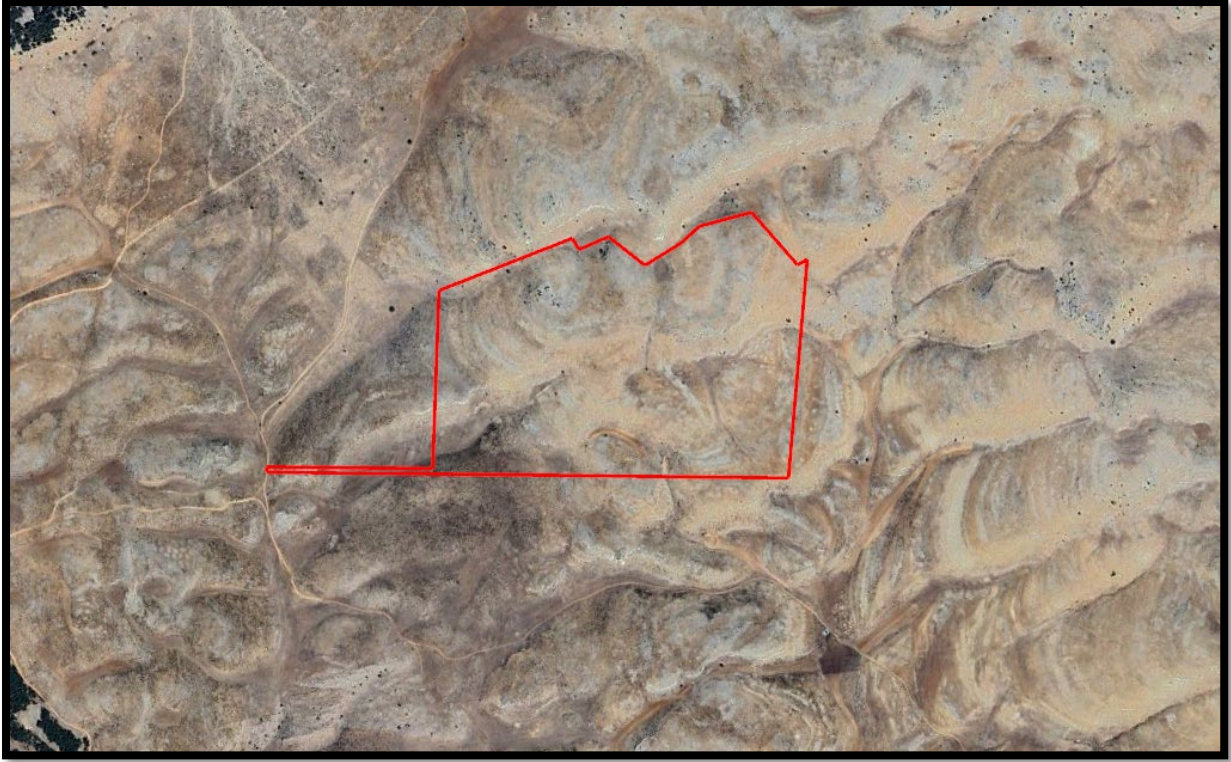
Şekil 2. Planlama Alanı Yakın Uydu Görüntüsü