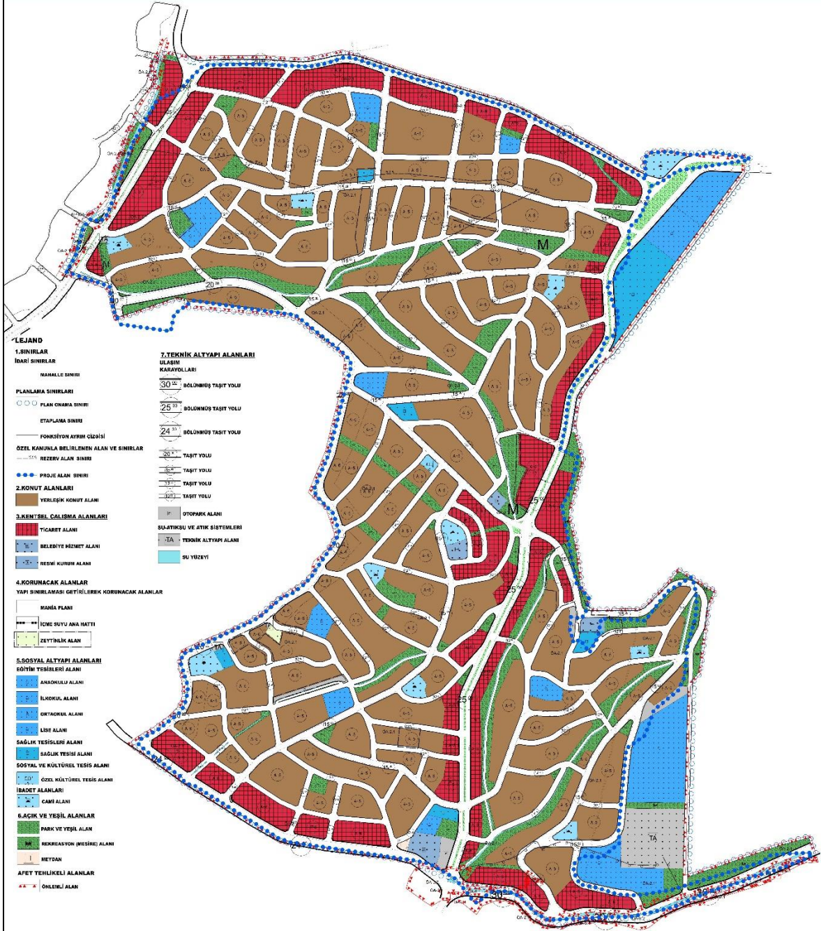
Şekil 3: Revizyon Uygulama İmar Planı