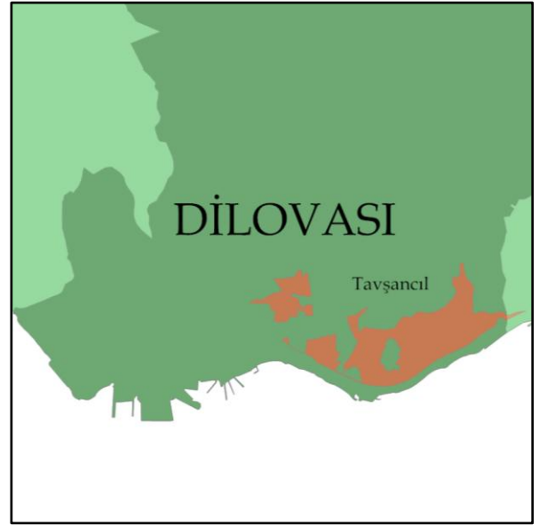
Harita 2 - Planlama Alanı Konumu