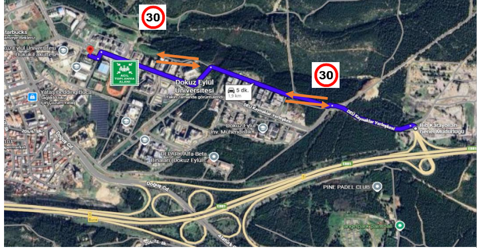
Şekil 6: Trafik Eylem Planı