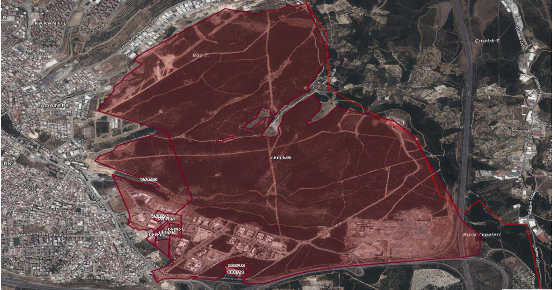
Şekil 2: Kampüs Sınırları (53097/1, 750/65, 750/24, 750/25, 803/12, 803/14, 803/20, 800/10, 800/11 Parsel)

Kampüs sınırlarını gösterir uydu görseli Şekil 2’de sunulmaktadır.