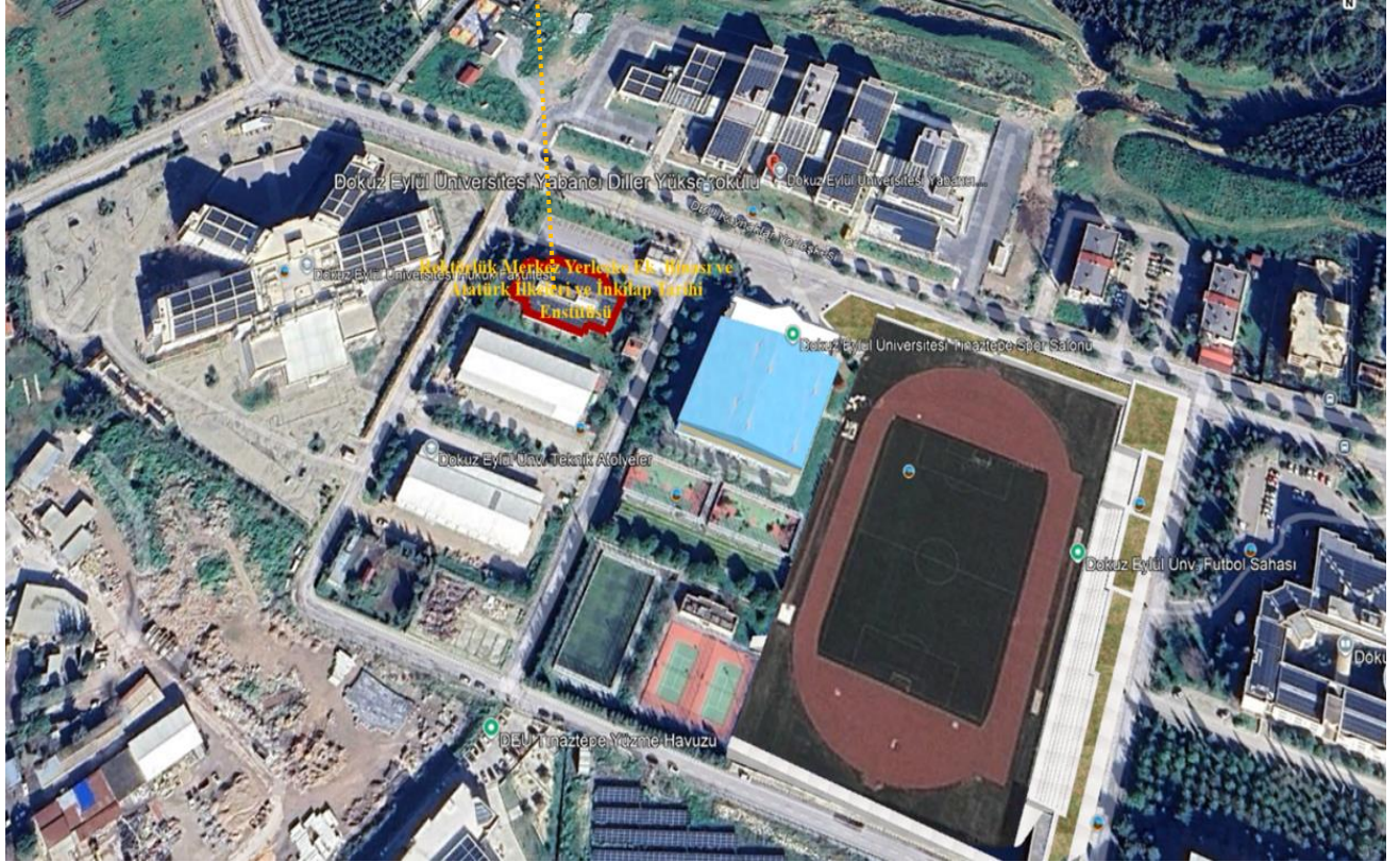
Şekil 1: Tınaztepe Kampüsü, Rektörlük Merkez Yerleşke Ek Binası ve Atatürk İlkeleri ve İnkılap Tarihi Enstitüsü Binası