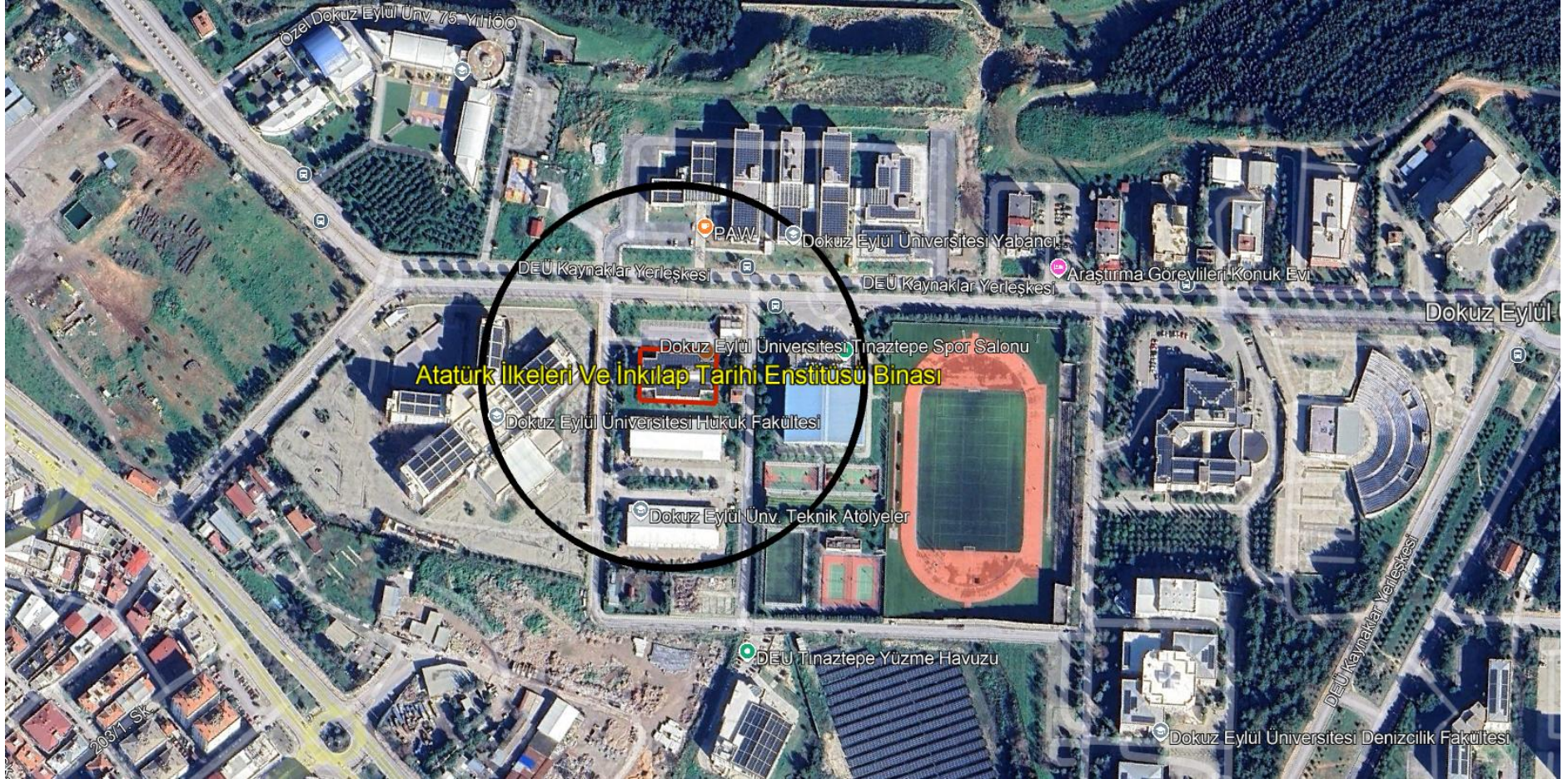
Şekil 4: Proje Kapsamına Giren Binanın Majör Etki Alanı ve Yakın Çevresi Görüntüsü