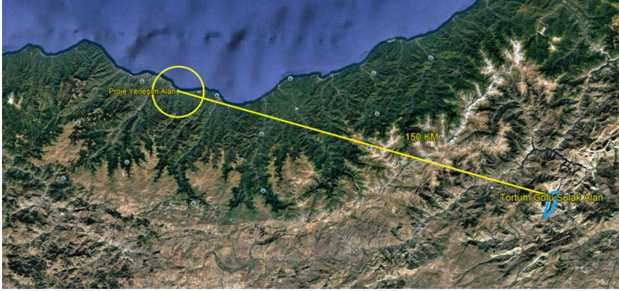
Şekil 7 Tortum Gölü Sulak Alanı'nın Konumunu Gösterir Uydu Görüntüsü

Yapılan mekânsal incelemeler ve mevcut veriler doğrultusunda, proje yerleşim alanının korunan alanlar ve sulak alanlar ile herhangi bir mekânsal çakışmasının bulunmadığı, bu alanlarla doğrudan veya dolaylı bir etkileşim içerisinde olmadığı değerlendirilmiştir. Projenin konumu, ölçeği ve uygulanacak faaliyetlerin niteliği dikkate alındığında, korunan alanlar, sulak alanlar ve bu alanlara özgü ekosistem bileşenleri üzerinde olumsuz bir çevresel etki oluşturması beklenmemektedir. Bu kapsamda proje faaliyetlerinin, söz konusu alanların bütünlüğü ve ekolojik işlevleri üzerinde herhangi bir bozucu veya kısıtlayıcı etki yaratmayacağı öngörülmektedir.