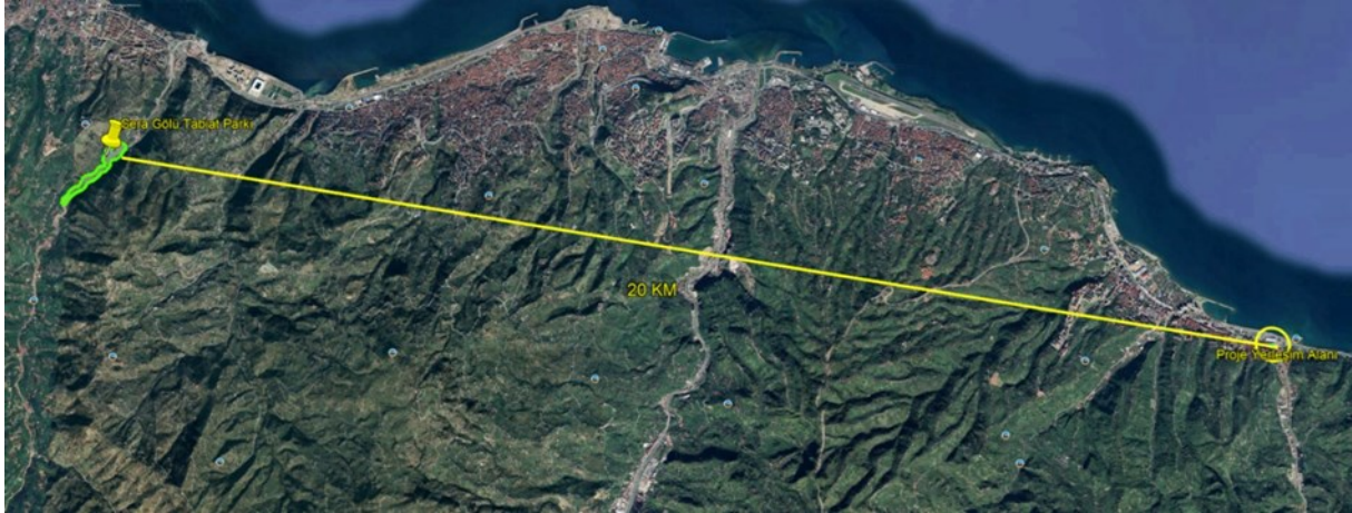
Şekil 6 Sera Gölü Tabiat Parkı'nın Konumunu Gösterir Uydu Görüntüsü

Proje yerleşim alanı ile en yakın korunan alan ve sulak alanların konumu ile aralarındaki mesafeler Şekil 6 ve Şekil 7'de şematik olarak gösterilmiştir.