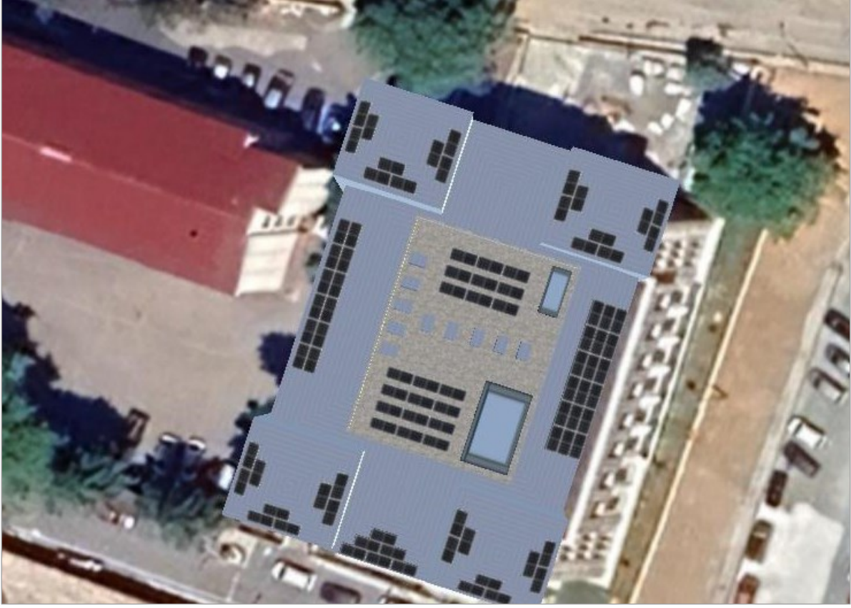
Şekil 2 Alt Proje Yerleşim Alanı