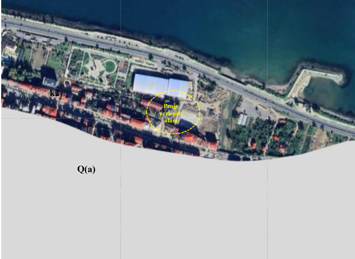
Şekil 5 .GES ve Yakın Çevresinin Genel Jeolojisi

Yararlanıcı Kurum çatısı üzerine kurulması planlanan Güneş Enerjisi Santrali'nin yakın çevresinde yer alan genel jeolojik formasyonları gösterir harita ve açıklamalarını içeren tablo aşağıda görülmektedir. Proje alanına ilişkin jeolojik formasyon bilgileri, Maden Teknik Arama (MTA) Genel Müdürlüğü Yer Bilimleri Harita Görüntüleyicisi üzerinden elde edilmiştir.