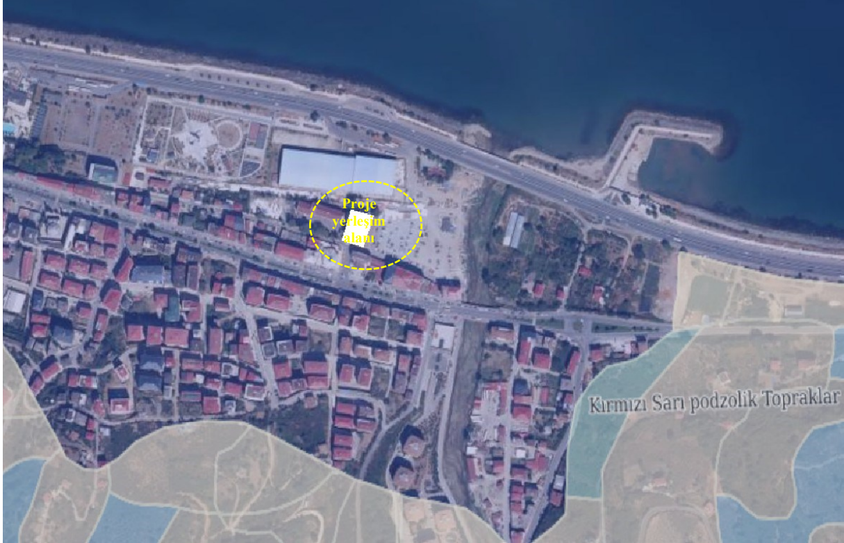
Şekil 4. GES ve Yakın Çevresinin Arazi Kullanım Durumu

Proje alanına ait mevcut arazi kullanım durumunu gösteren TUCBS tabanlı harita aşağıda sunulmuştur.