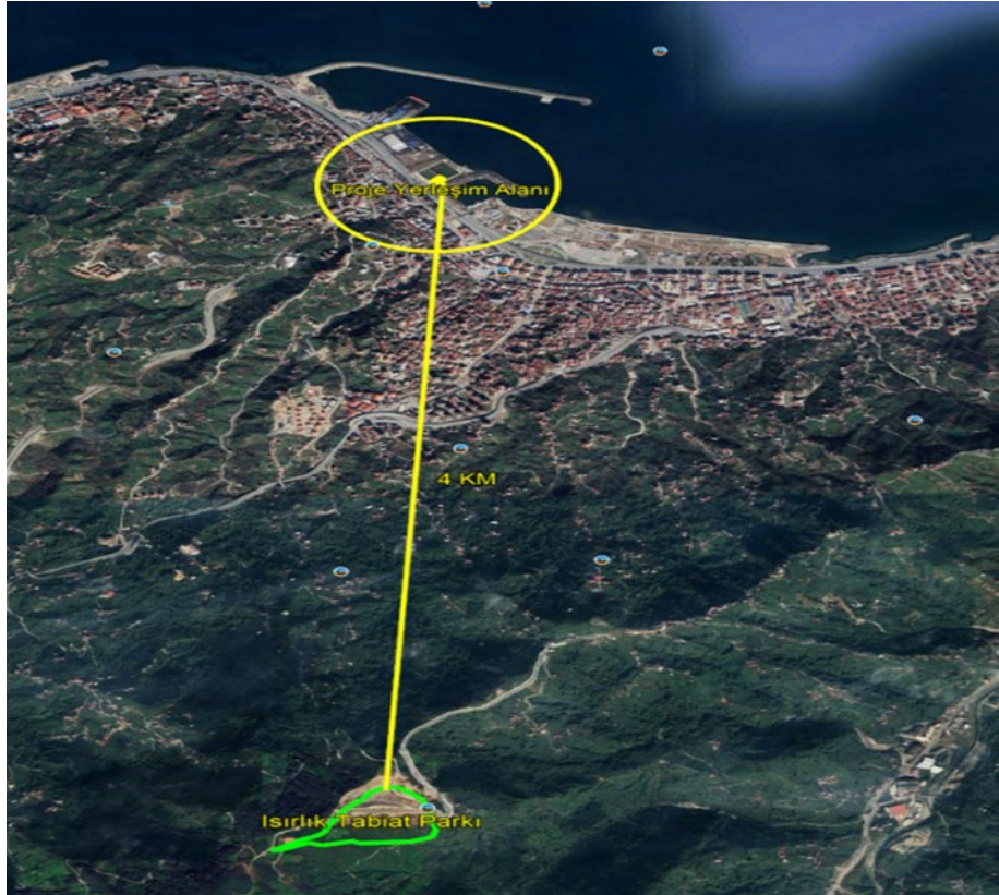
Şekil 6 Isırlık Tabiat Parkı'nın Konumunu Gösterir Uydu Görüntüsü

Proje yerleşim alanı ile en yakın korunan alan ve sulak alanların konumu ile aralarındaki mesafeler Şekil 6 ve Şekil 7'de şematik olarak gösterilmiştir.