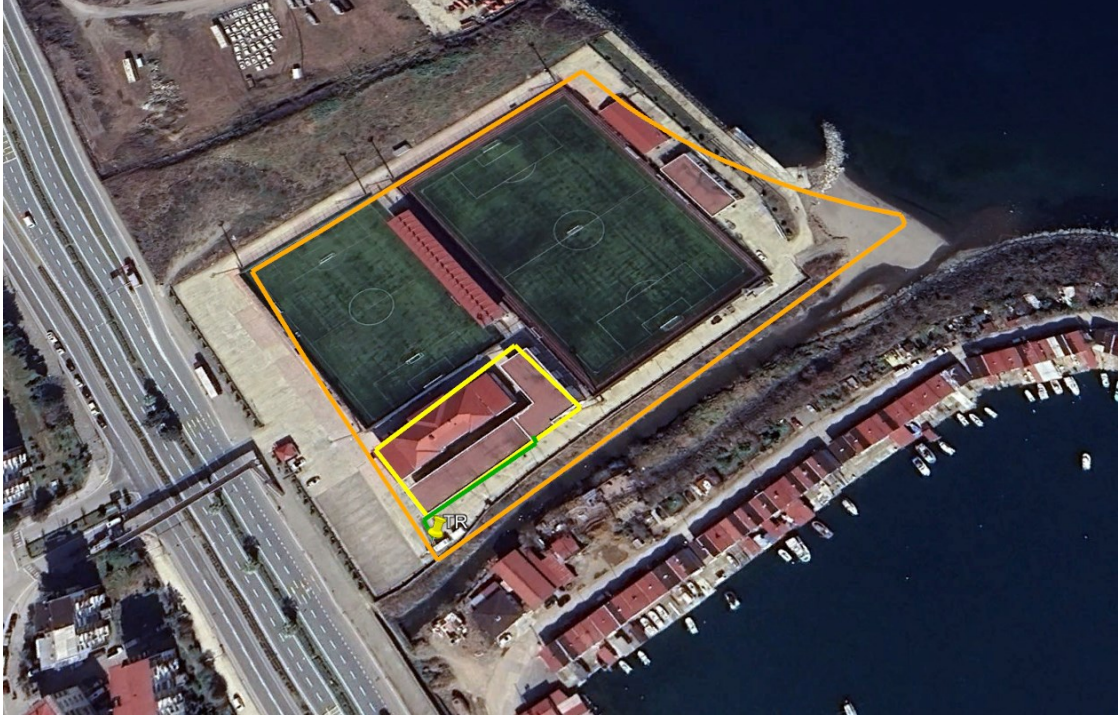
Şekil 1 Proje Alanı Uydu Görüntüsü