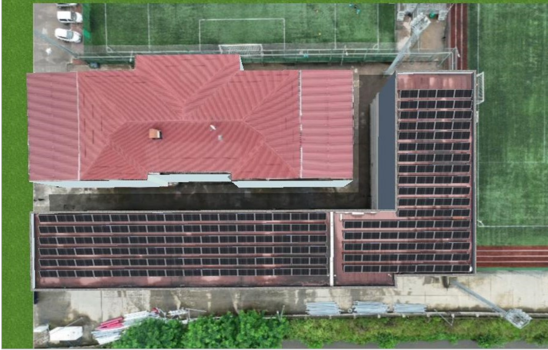
Şekil 2 Alt Proje Yerleşim Alanı