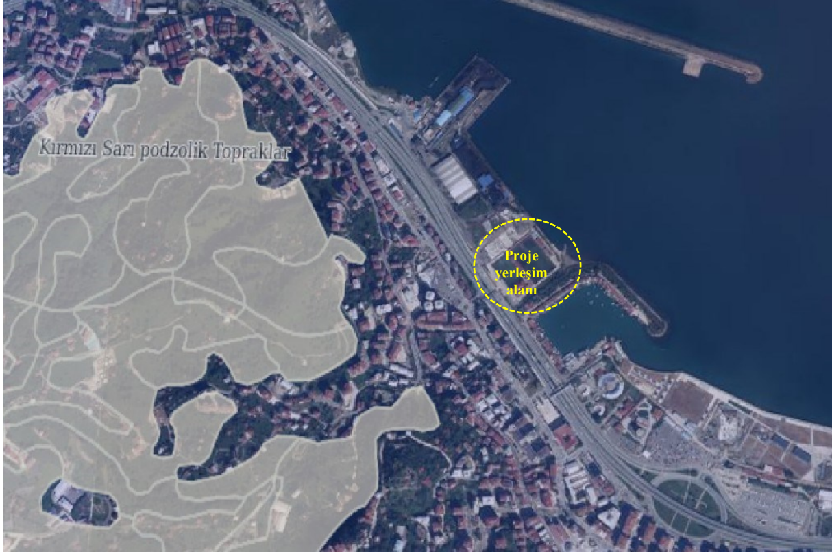
Şekil 4. GES ve Yakın Çevresinin Arazi Kullanım Durumu

TUCBS verilerine göre proje sahası ve yakın çevresi ağırlıklı olarak Kırmızı Sarı Podzolik Topraklar biriminden oluşmaktadır. Söz konusu toprak birimleri, bölgesel toprak sınıflandırmaları kapsamında değerlendirilmiştir. Söz konusu toprak birimleri, bölgesel toprak sınıflandırmaları kapsamında değerlendirilmiş olup; genel olarak doğal ve/veya yarı-doğal ekosistem koşulları altında gelişmiş, orta derinlikte veya yer yer sınırlı derinliğe sahip toprak profilleri ile karakterize edilmektedir. Bölgenin topoğrafik özelliklerine bağlı olarak bazı kesimlerde toprak derinliğinin değişiklik gösterebileceği değerlendirilmektedir.