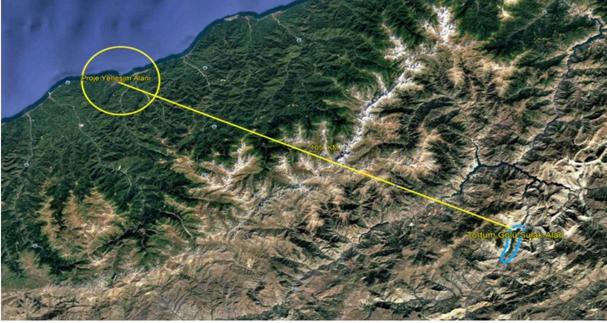
Şekil 7 Tortum Gölü Sulak Alanı'nın Konumunu Gösterir Uydu Görüntüsü

Yapılan mekânsal incelemeler ve mevcut veriler doğrultusunda, proje yerleşim alanının korunan alanlar ve sulak alanlar ile herhangi bir mekânsal çakışmasının bulunmadığı, bu alanlarla doğrudan veya dolaylı bir etkileşim içerisinde olmadığı değerlendirilmiştir. Projenin konumu, ölçeği ve uygulanacak faaliyetlerin niteliği dikkate alındığında, korunan alanlar, sulak alanlar ve bu alanlara özgü ekosistem bileşenleri üzerinde olumsuz bir çevresel etki oluşturması beklenmemektedir. Bu kapsamda proje faaliyetlerinin, söz konusu alanların bütünlüğü ve ekolojik işlevleri üzerinde herhangi bir bozucu veya kısıtlayıcı etki yaratmayacağı öngörülmektedir.