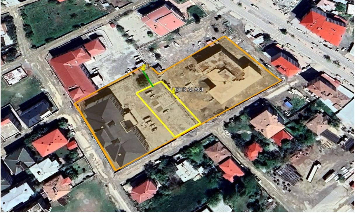
Şekil 1 Proje Alanı Uydu Görüntüsü