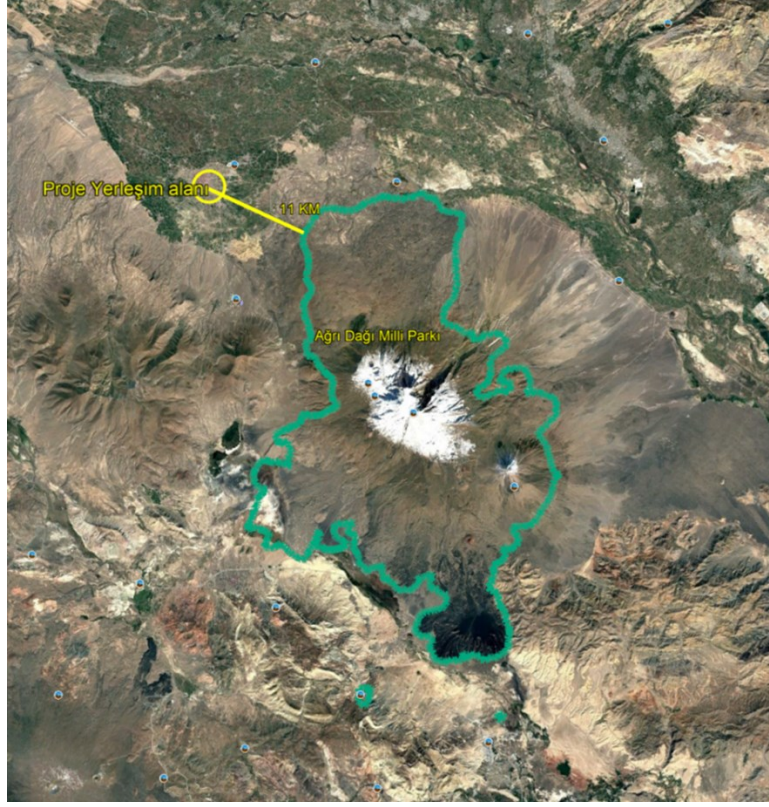
Şekil 6 Ağrı Dağı Milli Parkı'nın Konumunu Gösterir Uydu Görüntüsü