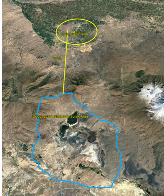
Şekil 7 Doğubeyazıt Sazlıkları Sulak Alanı'nın Konumunu Gösterir Uydu Görüntüsü