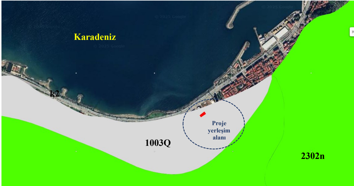
Şekil 5 .GES ve Yakın Çevresinin Genel Jeolojisi

Yararlanıcı Kurum otoparkı üzerine kurulması planlanan Güneş Enerjisi Santrali'nin yakın çevresinde yer alan genel jeolojik formasyonları gösterir harita ve açıklamalarını içeren tablo aşağıda görülmektedir. Proje alanına ilişkin jeolojik formasyon bilgileri, Maden Teknik Arama (MTA) Genel Müdürlüğü Yer Bilimleri Harita Görüntüleyicisi üzerinden elde edilmiştir.