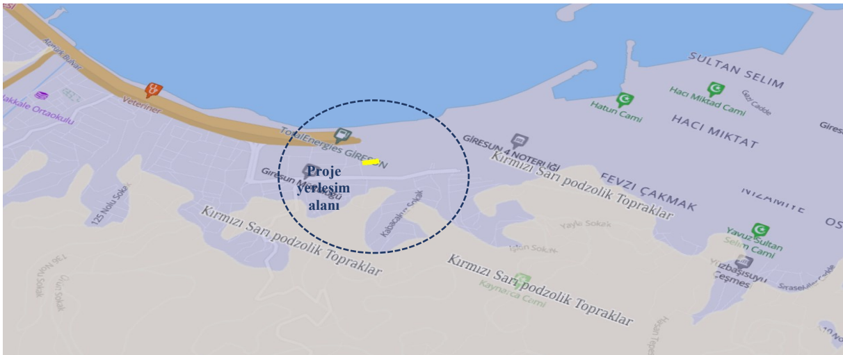
Şekil 4. GES ve Yakın Çevresinin Arazi Kullanım Durumu

Proje alanına ait mevcut arazi kullanım durumunu gösteren TUCBS tabanlı harita aşağıda sunulmuştur.