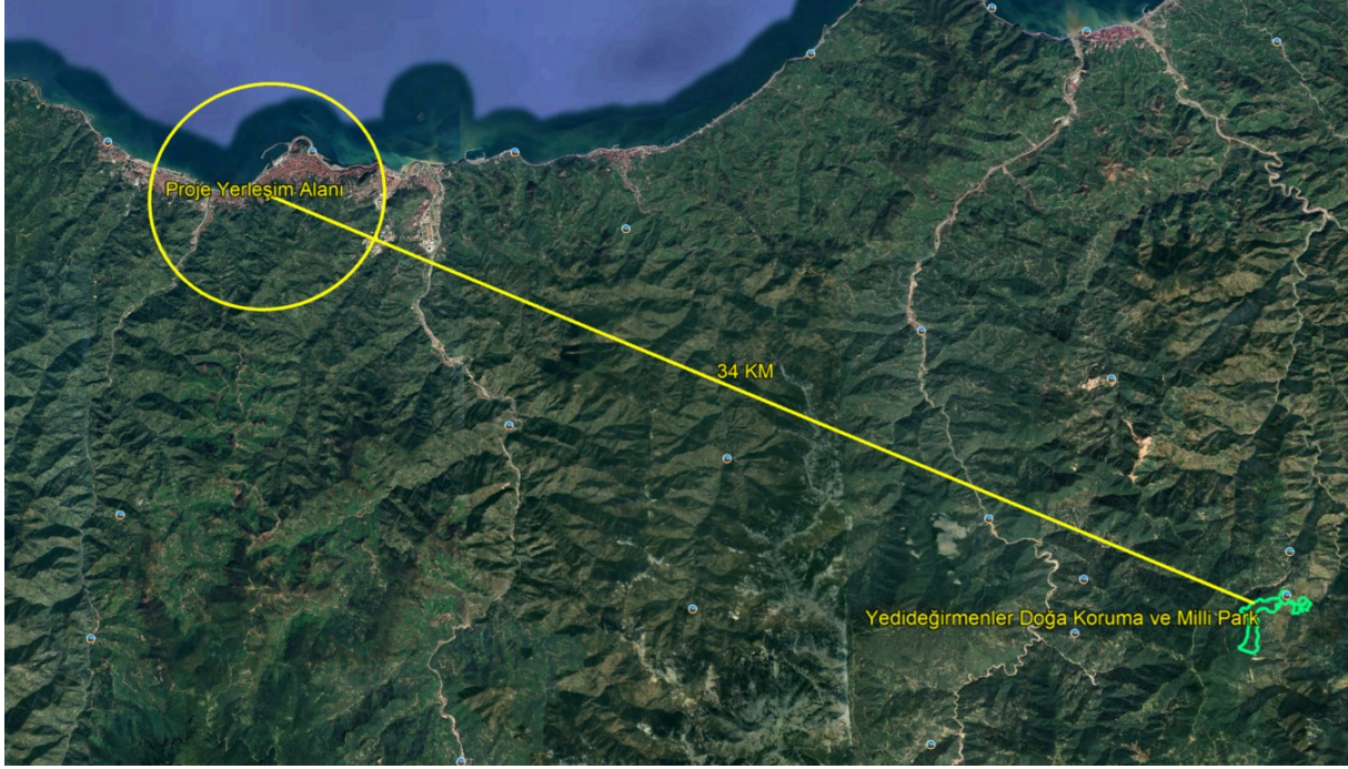
Şekil 6 Yedideğirmenler Doğa Koruma ve Milli Parkı'nın Konumunu Gösterir Uydu Görüntüsü