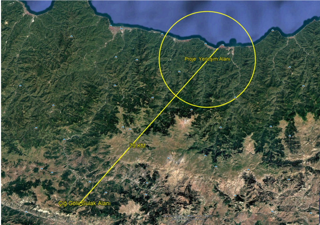
Şekil 7 Çığ Gölü Sulak Alanı'nın Konumunu Gösterir Uydu Görüntüsü