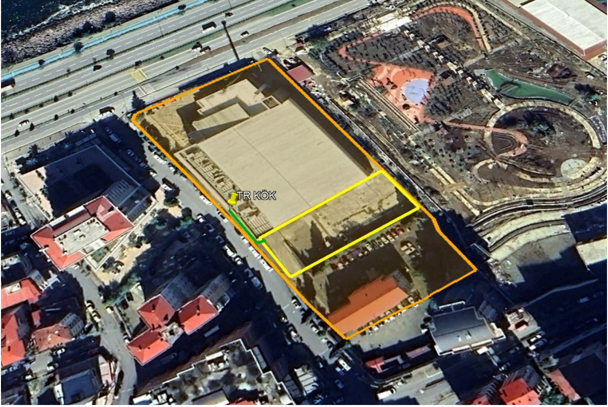
Şekil 1 Proje Alanı Uydu Görüntüsü