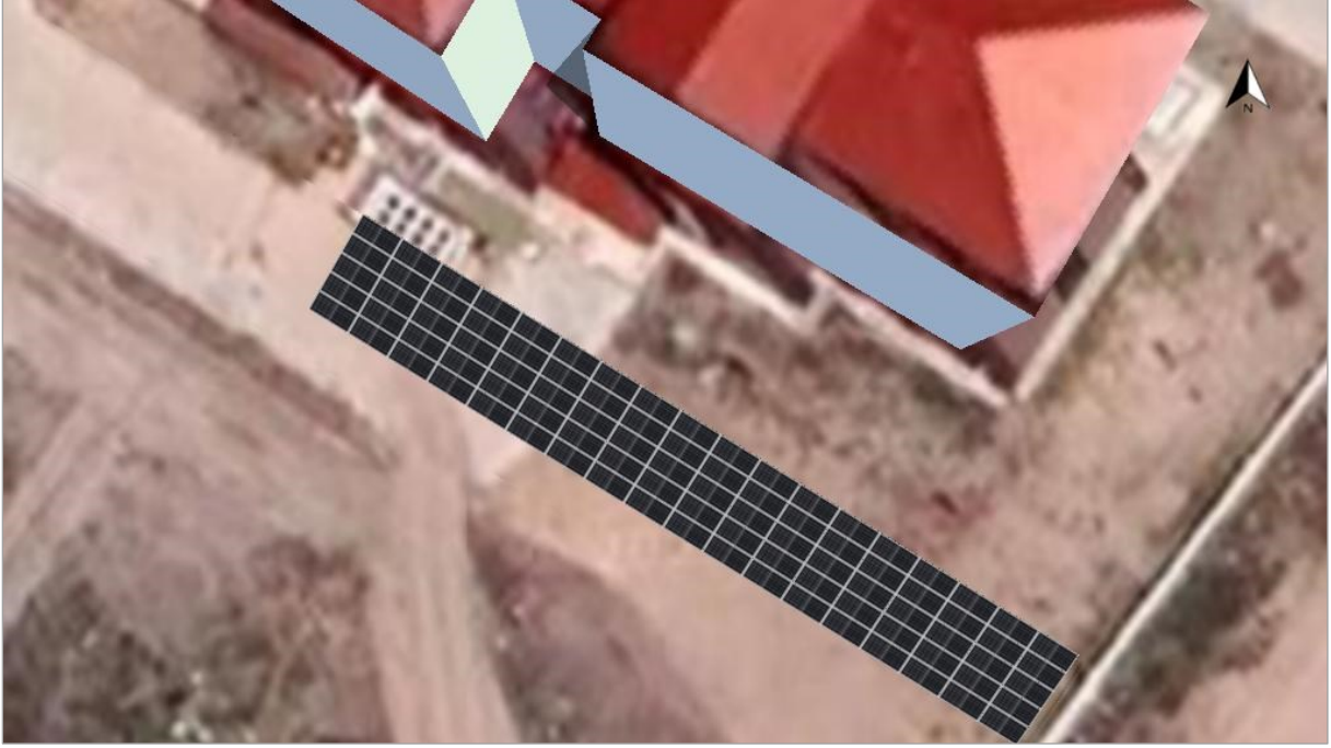
Şekil 2 Alt Proje Yerleşim Alanı