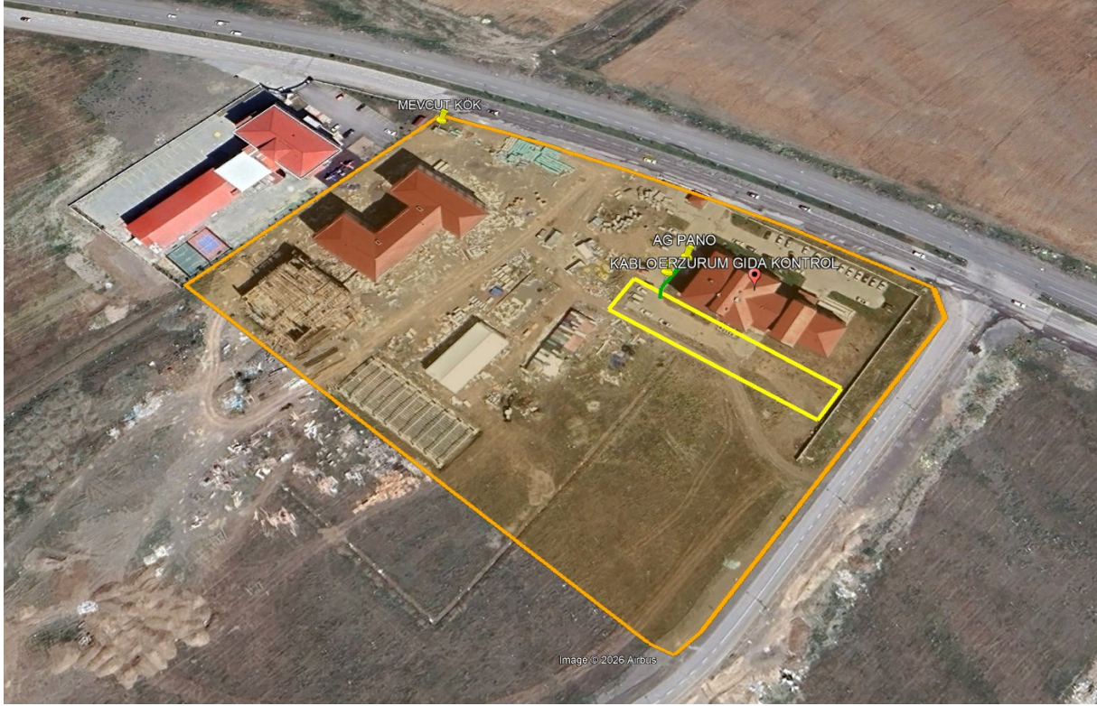
Şekil 1 Proje Alanı Uydu Görüntüsü