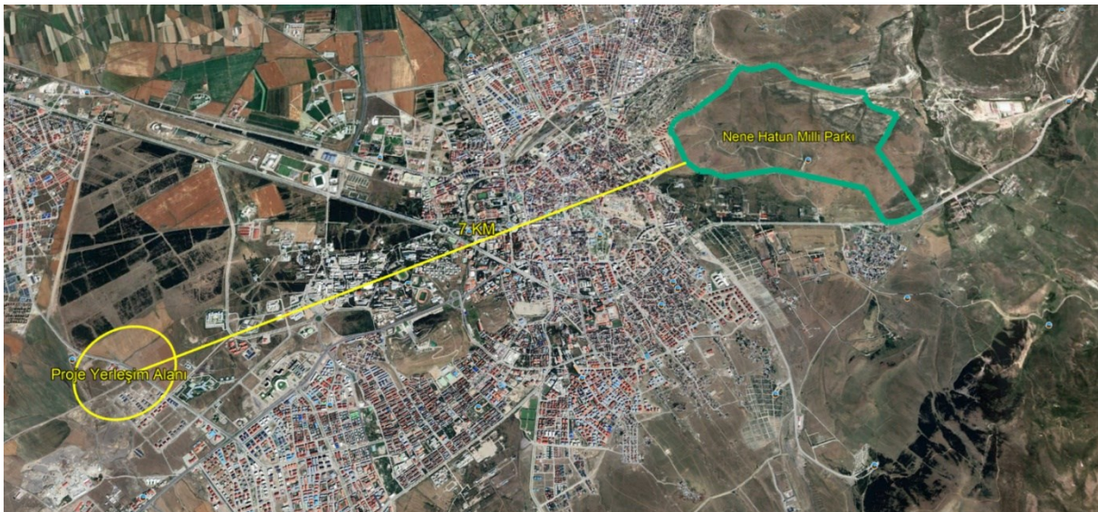
Şekil 6 Nene Hatun Milli Parkı'nın Konumunu Gösterir Uydu Görüntüsü

Proje yerleşim alanı ile en yakın korunan alan ve sulak alanların konumu ile aralarındaki mesafeler Şekil 6 ve Şekil 7'de şematik olarak gösterilmiştir.