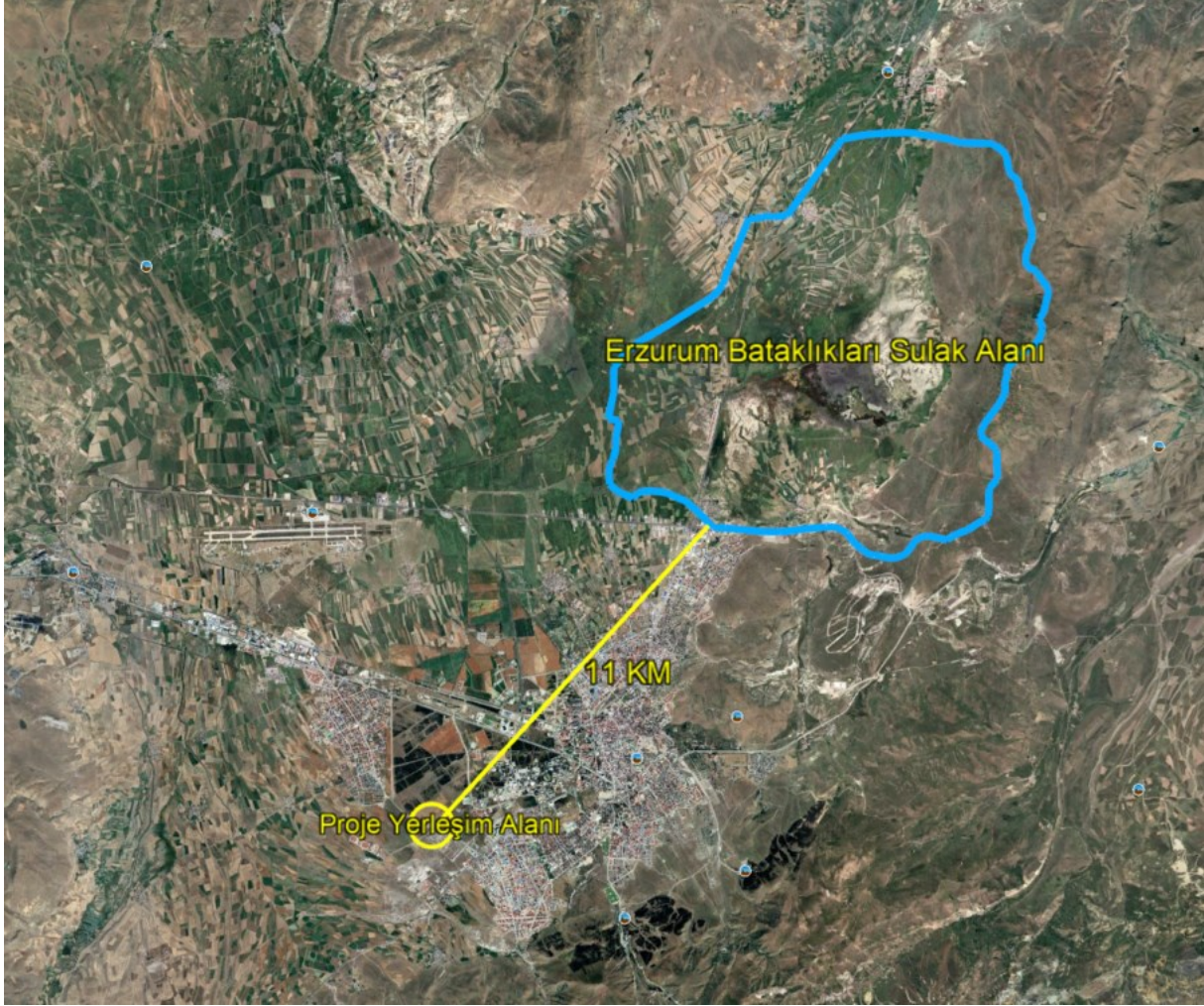
Şekil 7 Erzurum Bataklıkları Sulak Alanı'nın Konumunu Gösterir Uydu Görüntüsü

Yapılan mekânsal incelemeler ve mevcut veriler doğrultusunda, proje yerleşim alanının korunan alanlar ve sulak alanlar ile herhangi bir mekânsal çakışmasının bulunmadığı, bu alanlarla doğrudan veya dolaylı bir etkileşim içerisinde olmadığı değerlendirilmiştir. Projenin konumu, ölçeği ve uygulanacak faaliyetlerin niteliği dikkate alındığında, korunan alanlar, sulak alanlar ve bu alanlara özgü ekosistem bileşenleri üzerinde olumsuz bir çevresel etki oluşturması beklenmemektedir. Bu kapsamda proje faaliyetlerinin, söz konusu alanların bütünlüğü ve ekolojik işlevleri üzerinde herhangi bir bozucu veya kısıtlayıcı etki yaratmayacağı öngörülmektedir.