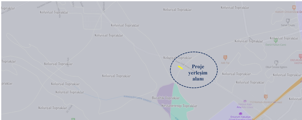
Şekil 4. GES ve Yakın Çevresinin Arazi Kullanım Durumu

Proje alanına ait mevcut arazi kullanım durumunu gösteren TUCBS tabanlı harita aşağıda sunulmuştur.