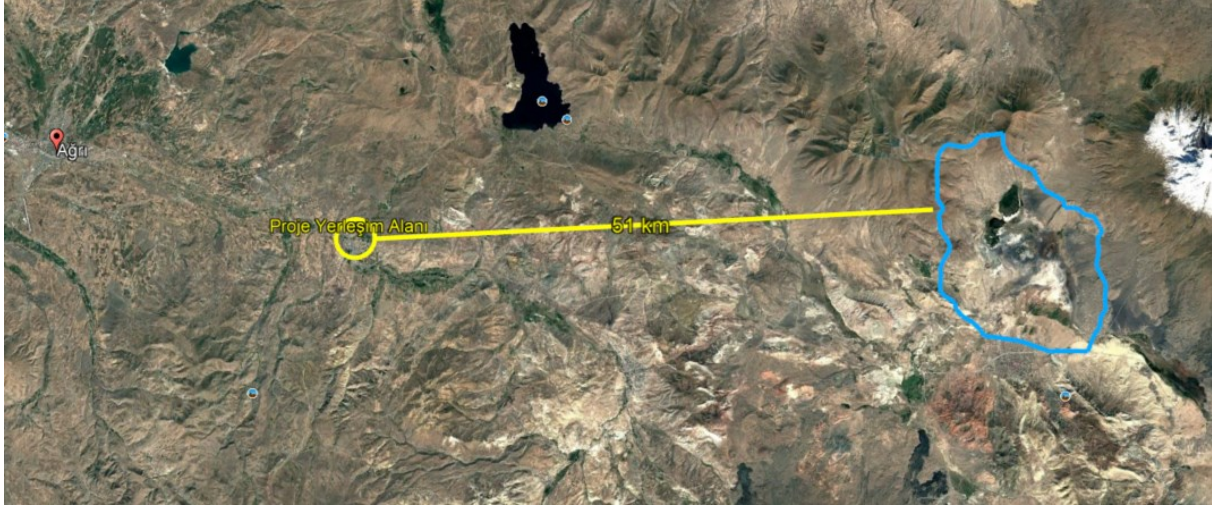
Şekil 7 Doğubeyazıt Sazlıkları Sulak Alanı'nın Konumunu Gösterir Uydu Görüntüsü

Yapılan mekânsal incelemeler ve mevcut veriler doğrultusunda, proje yerleşim alanının korunan alanlar ve sulak alanlar ile herhangi bir mekânsal çakışmasının bulunmadığı, bu alanlarla doğrudan veya dolaylı bir etkileşim içerisinde olmadığı değerlendirilmiştir. Projenin konumu, ölçeği ve uygulanacak faaliyetlerin niteliği dikkate alındığında, korunan alanlar, sulak alanlar ve bu alanlara özgü ekosistem bileşenleri üzerinde olumsuz bir çevresel etki oluşturması beklenmemektedir. Bu kapsamda proje faaliyetlerinin, söz konusu alanların bütünlüğü ve ekolojik işlevleri üzerinde herhangi bir bozucu veya kısıtlayıcı etki yaratmayacağı öngörülmektedir.