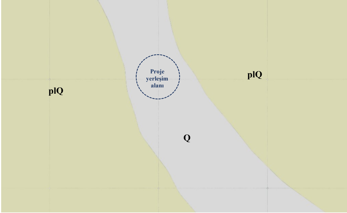
Şekil 5 .GES ve Yakın Çevresinin Genel Jeolojisi

Şekil 5' te verilen genel jeoloji haritası incelendiğinde, proje sahası ve yakın çevresinin Kuvaterner ve Pliyosen- Kuvaterner jeolojik yaş aralığına sahip kaya birimleri ile temsil edildiği görülmektedir. Harita üzerinde proje alanının bulunduğu kesimde, Q ve pIQ kodlu jeolojik birimler baskın litolojik özellik göstermektedir.