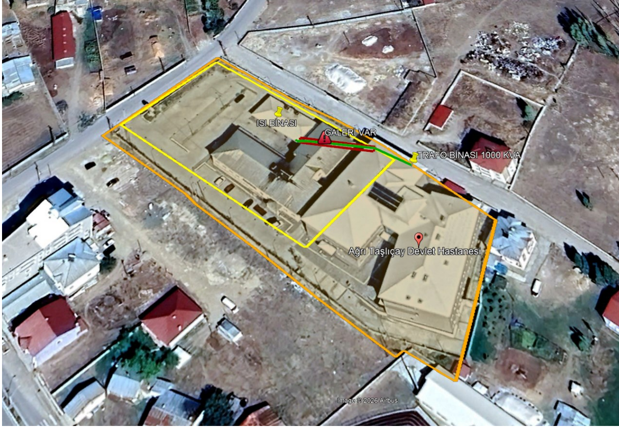
Şekil 1 Proje Alanı Uydu Görüntüsü