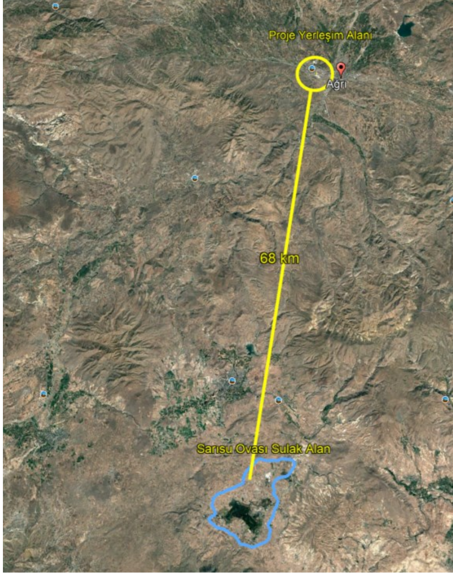
Şekil 7 Sarısu Ovası Sulak Alanı'nın Konumunu Gösterir Uydu Görüntüsü

Yapılan mekânsal incelemeler ve mevcut veriler doğrultusunda, proje yerleşim alanının korunan alanlar ve sulak alanlar ile herhangi bir mekânsal çakışmasının bulunmadığı, bu alanlarla doğrudan veya dolaylı bir etkileşim içerisinde olmadığı değerlendirilmiştir. Projenin konumu, ölçeği ve uygulanacak faaliyetlerin niteliği dikkate alındığında, korunan alanlar, sulak alanlar ve bu alanlara özgü ekosistem bileşenleri üzerinde olumsuz bir çevresel etki oluşturması beklenmemektedir. Bu kapsamda proje faaliyetlerinin, söz konusu alanların bütünlüğü ve ekolojik işlevleri üzerinde herhangi bir bozucu veya kısıtlayıcı etki yaratmayacağı öngörülmektedir.