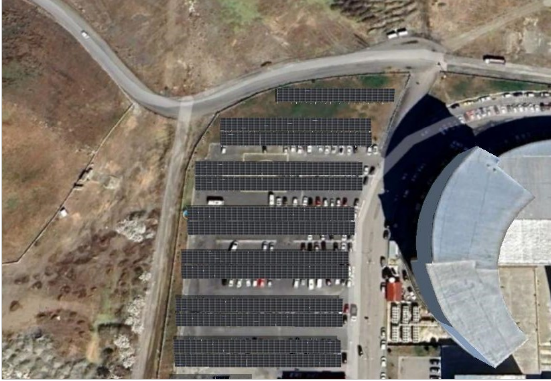
Şekil 2 Alt Proje Yerleşim Alanı