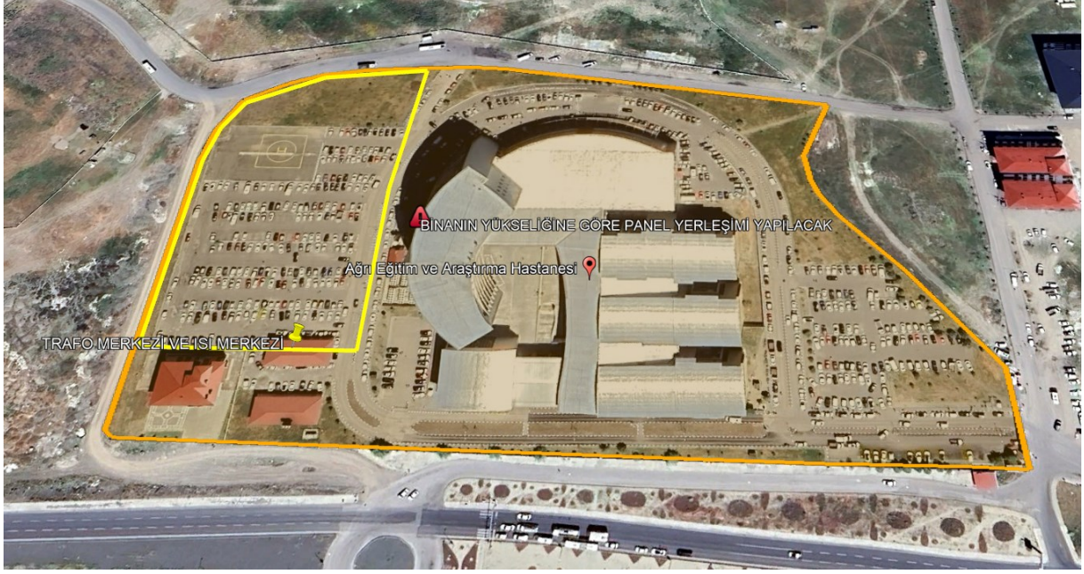
Şekil 1 Proje Alanı Uydu Görüntüsü