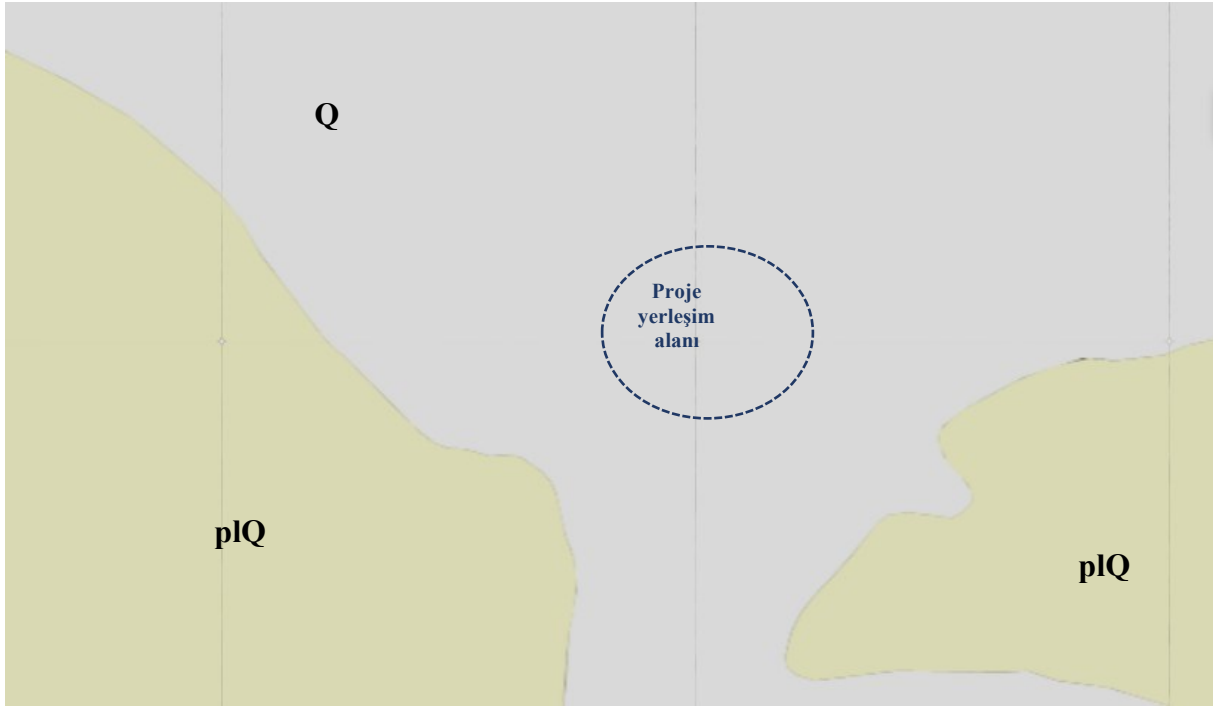
Şekil 5 .GES ve Yakın Çevresinin Genel Jeolojisi

Şekil 5' te verilen genel jeoloji haritası incelendiğinde, proje sahası ve yakın çevresinin Kuvaterner ve Pliyosen - Kuvaterner jeolojik yaş aralığına sahip kaya birimleri ile temsil edildiği görülmektedir. Harita üzerinde proje alanının bulunduğu kesimde, Q ve plQ kodlu jeolojik birimler baskın litolojik özellik göstermektedir.