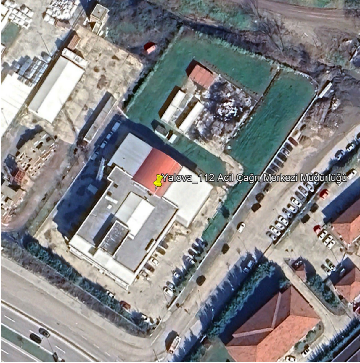
Şekil 1. Proje Alanı Uydu Görüntüsü