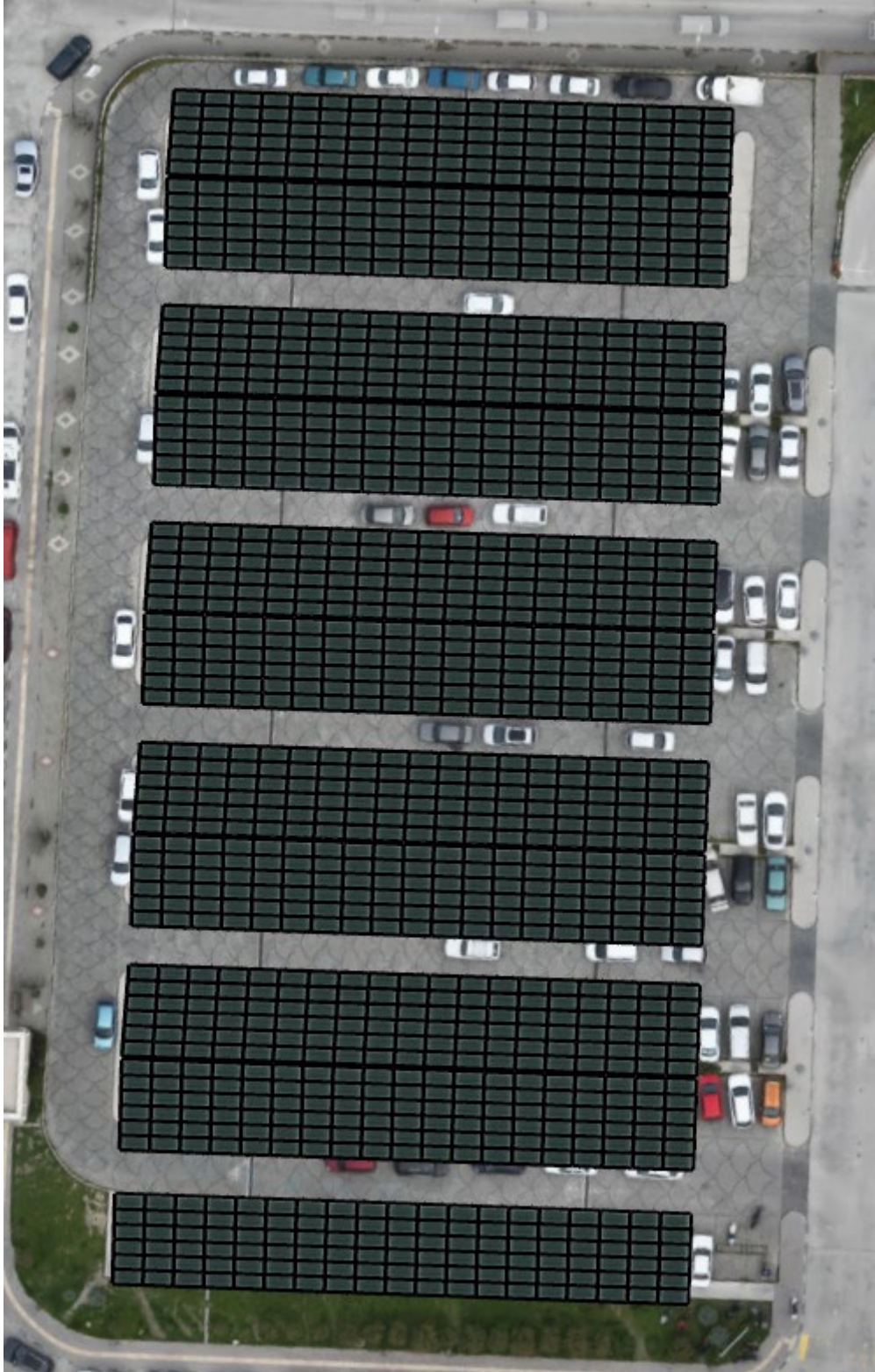
Şekil 2. Alt Proje Yerleşim Alanı