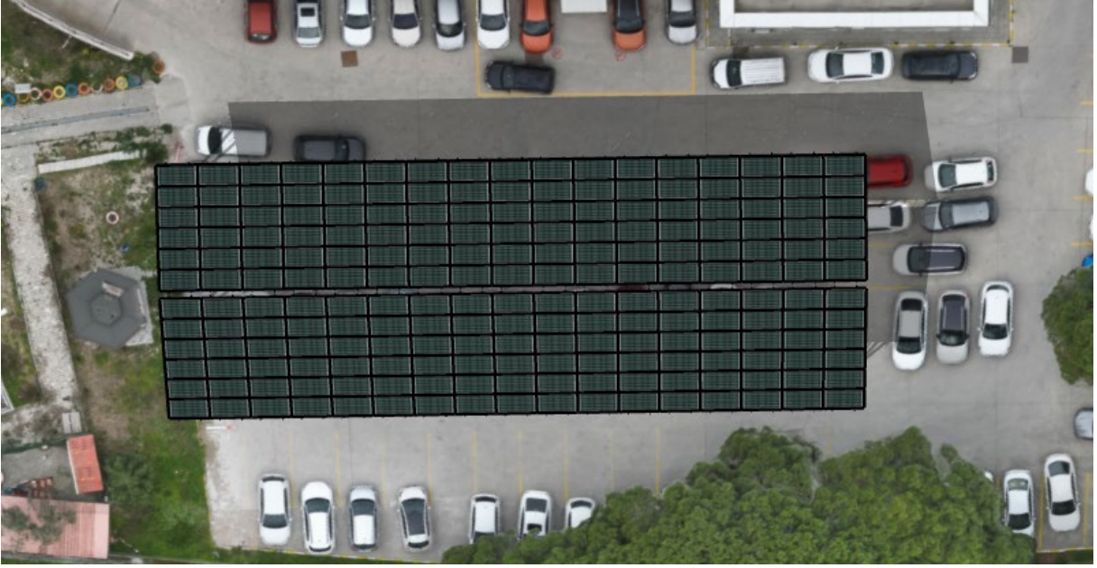
Şekil 2. Alt Proje Yerleşim Alanı