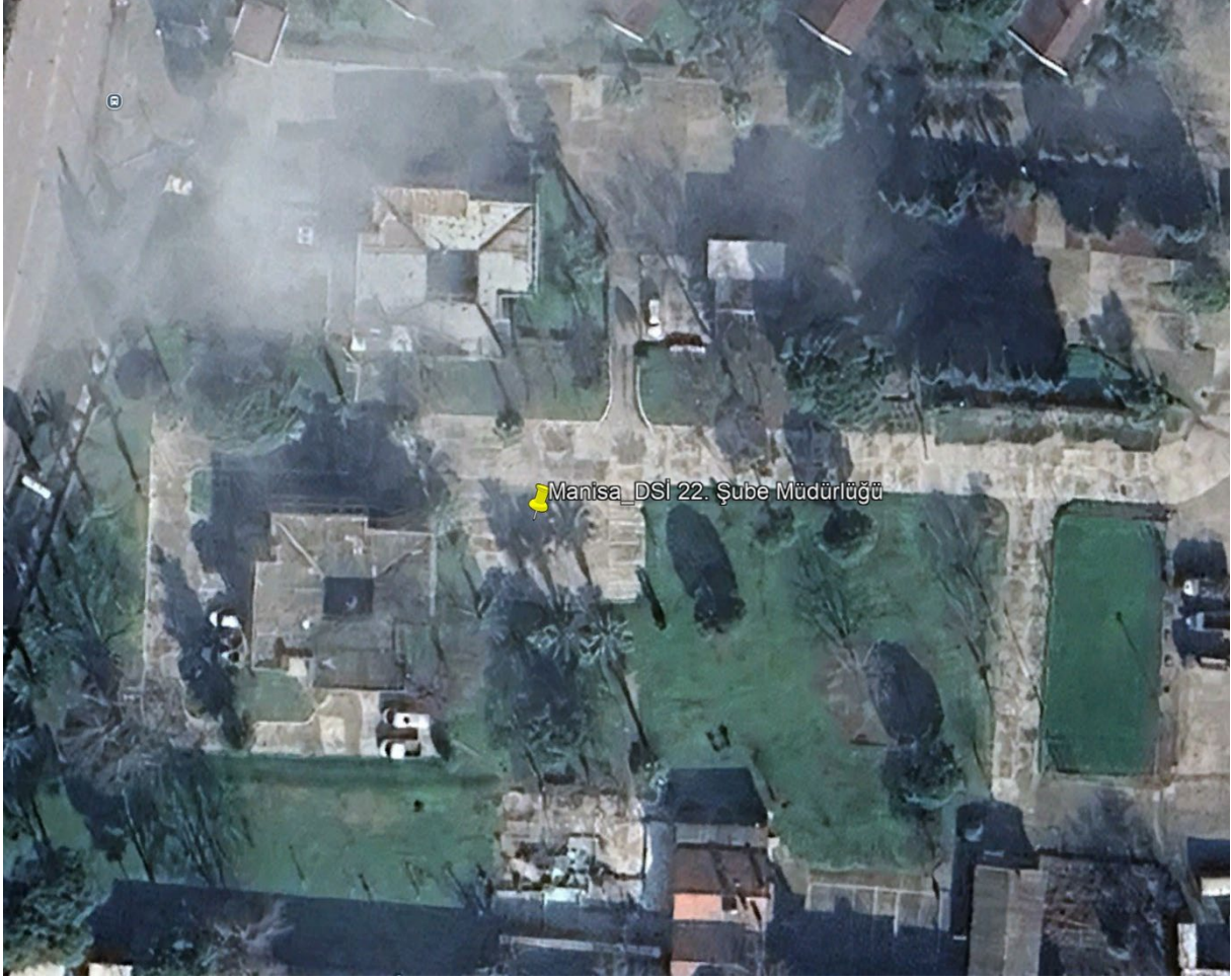
Şekil 1. Proje Alanı Uydu Görüntüsü