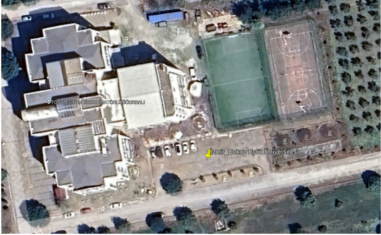
Şekil 1. Proje Alanı Uydu Görüntüsü