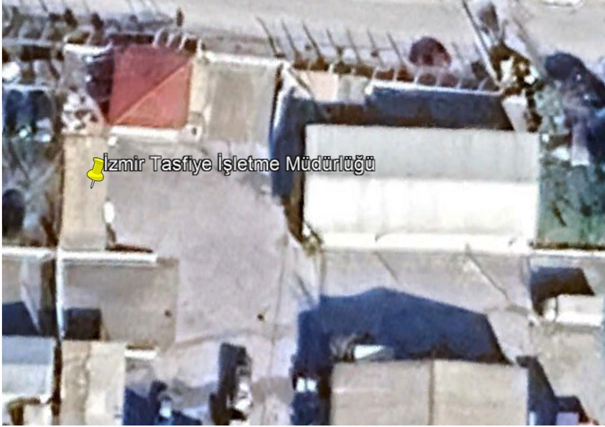
Şekil 1. Proje Alanı Uydu Görüntüsü