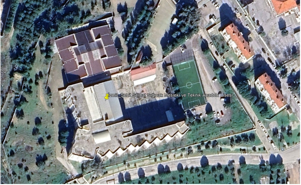
Şekil 1. Proje Alanı Uydu Görüntüsü