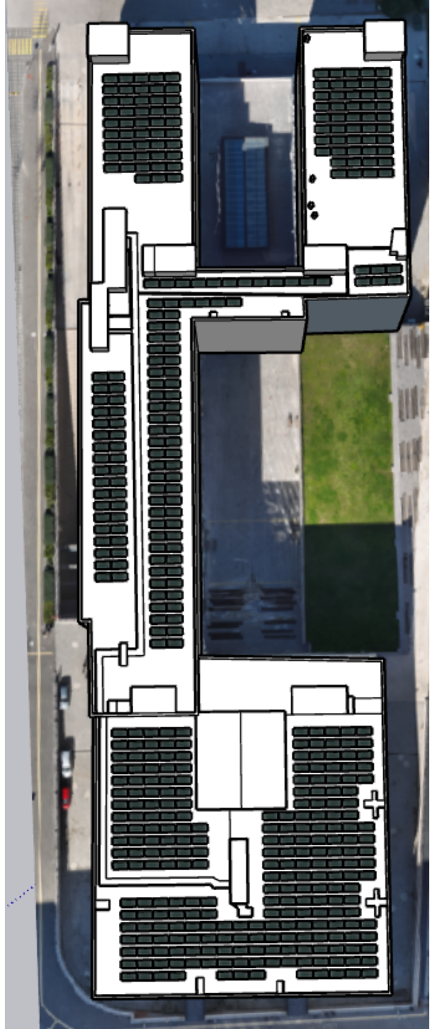
Şekil 2. Alt Proje Yerleşim Alanı