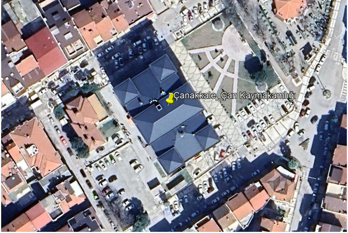
Şekil 1. Proje Alanı Uydu Görüntüsü