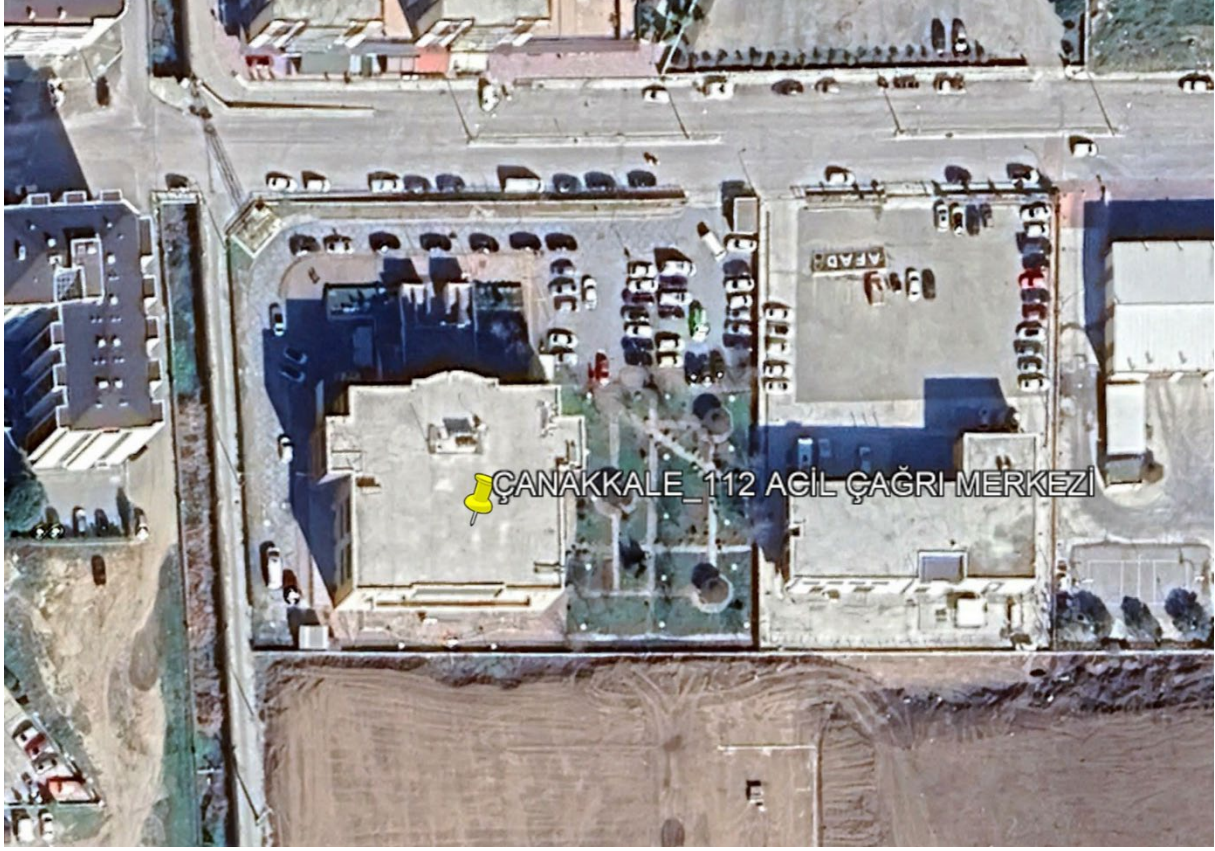
Şekil 1. Proje Alanı Uydu Görüntüsü