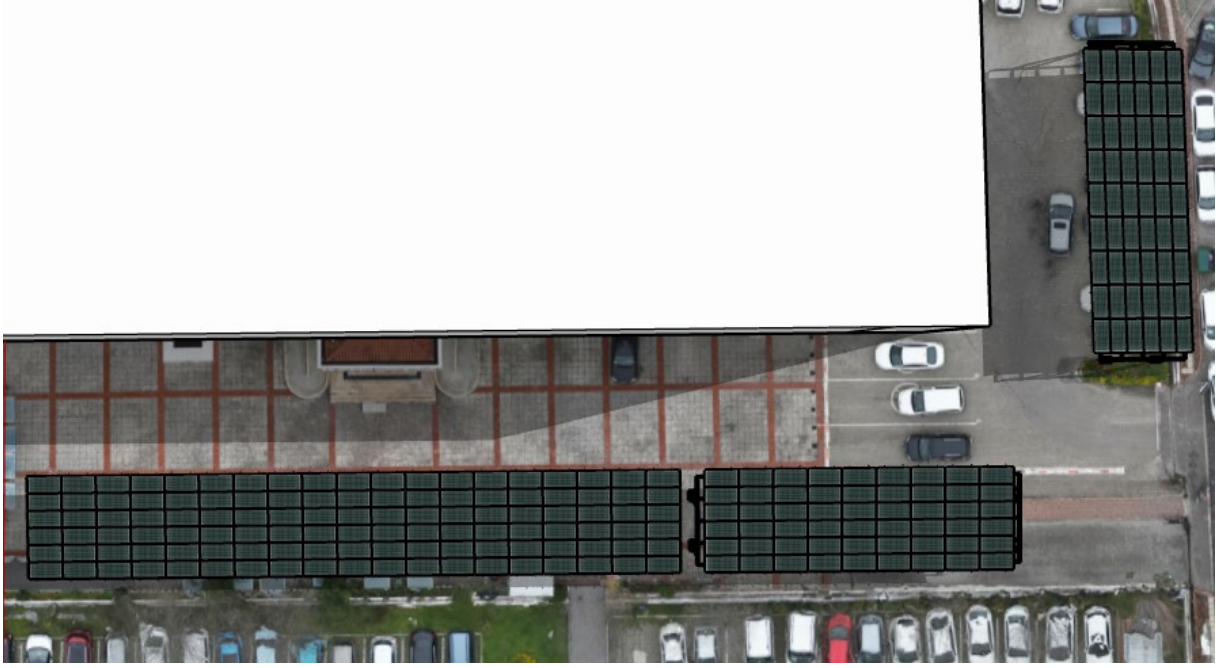
Şekil 2. Alt Proje Yerleşim Alanı