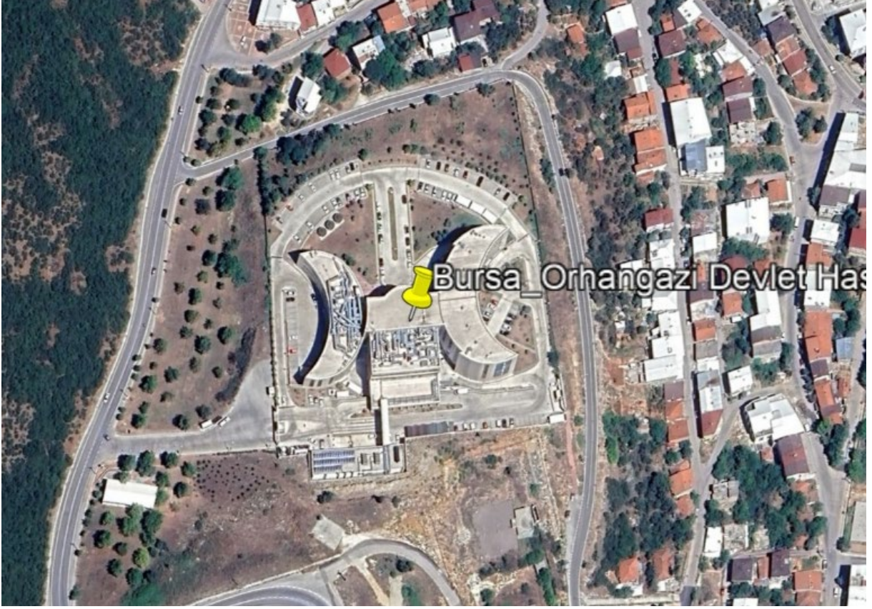
Şekil 1. Proje Alanı Uydu Görüntüsü