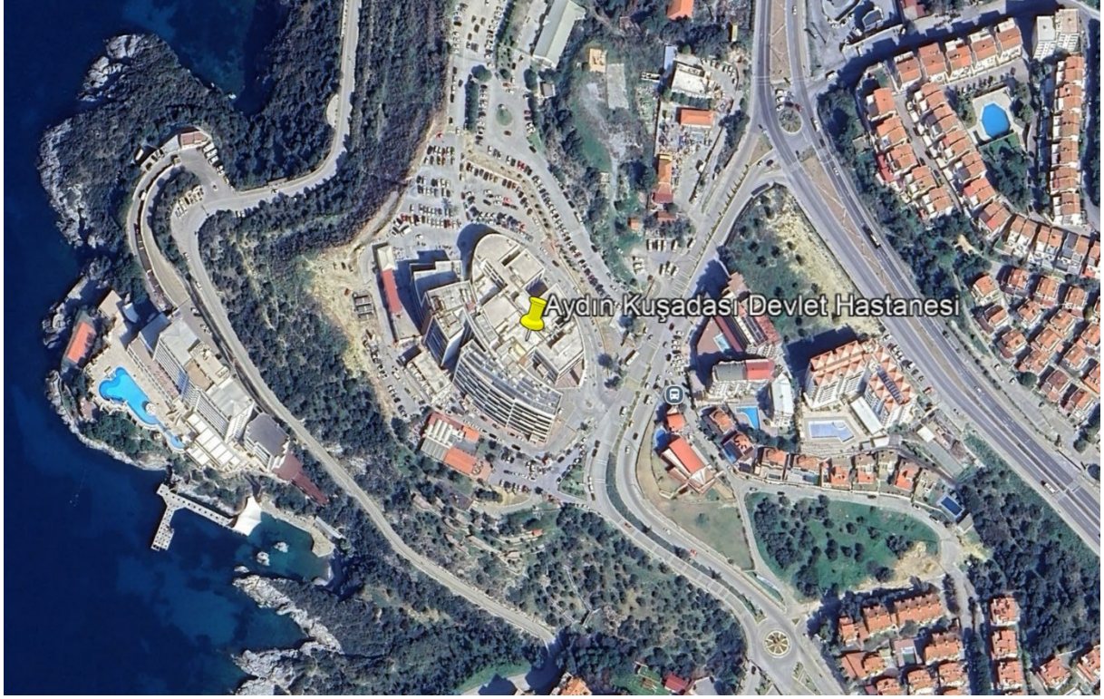
Şekil 1. Proje Alanı Uydu Görüntüsü