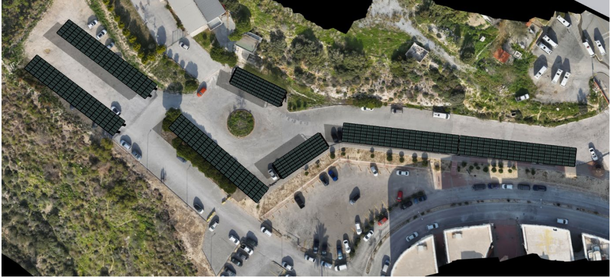
Şekil 2. Alt Proje Yerleşim Alanı