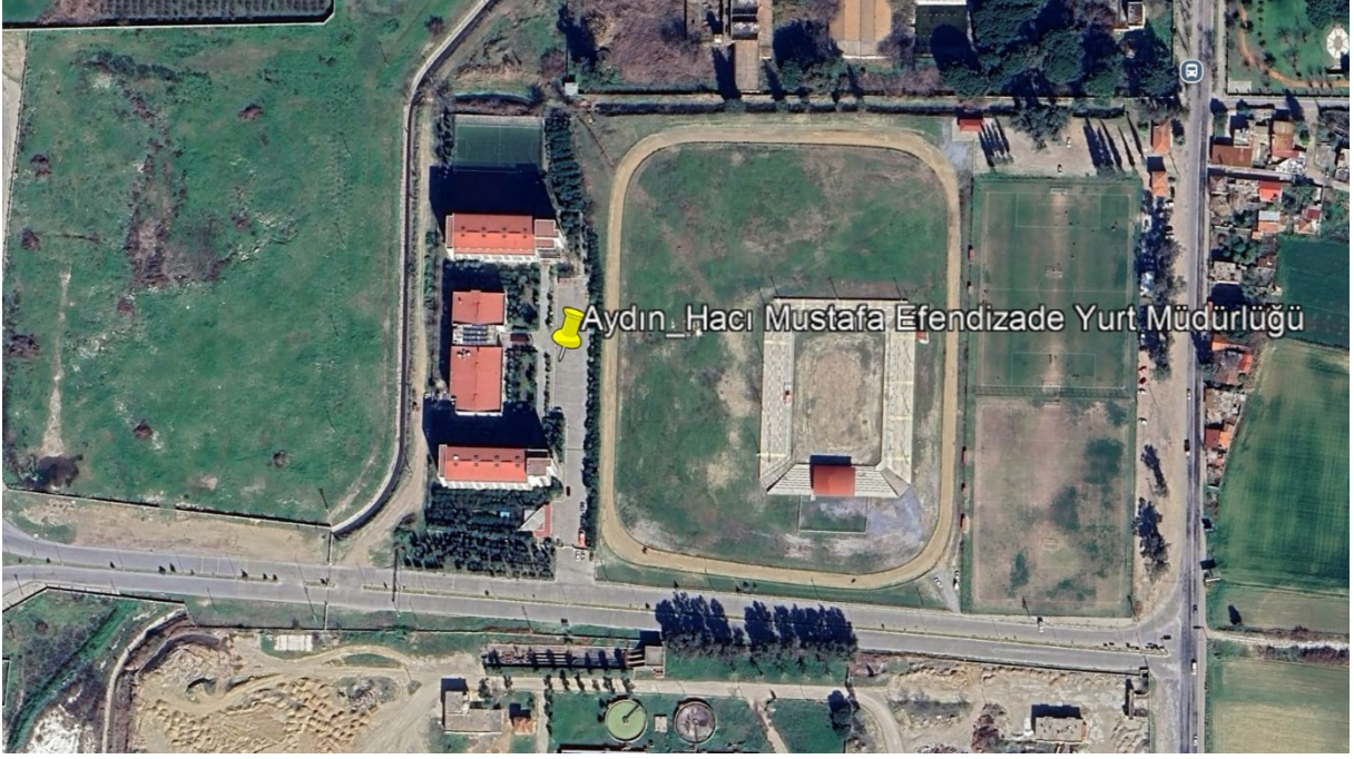
Şekil 1. Proje Alanı Uydu Görüntüsü