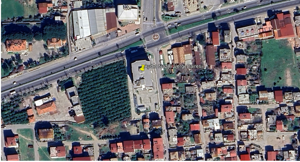
Şekil 1. Proje Alanı Uydu Görüntüsü