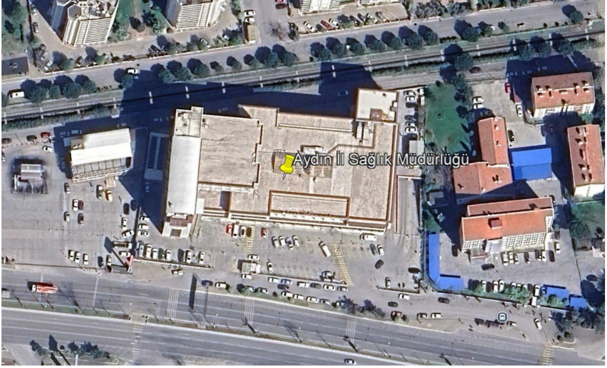
Şekil 1. Proje Alanı Uydu Görüntüsü