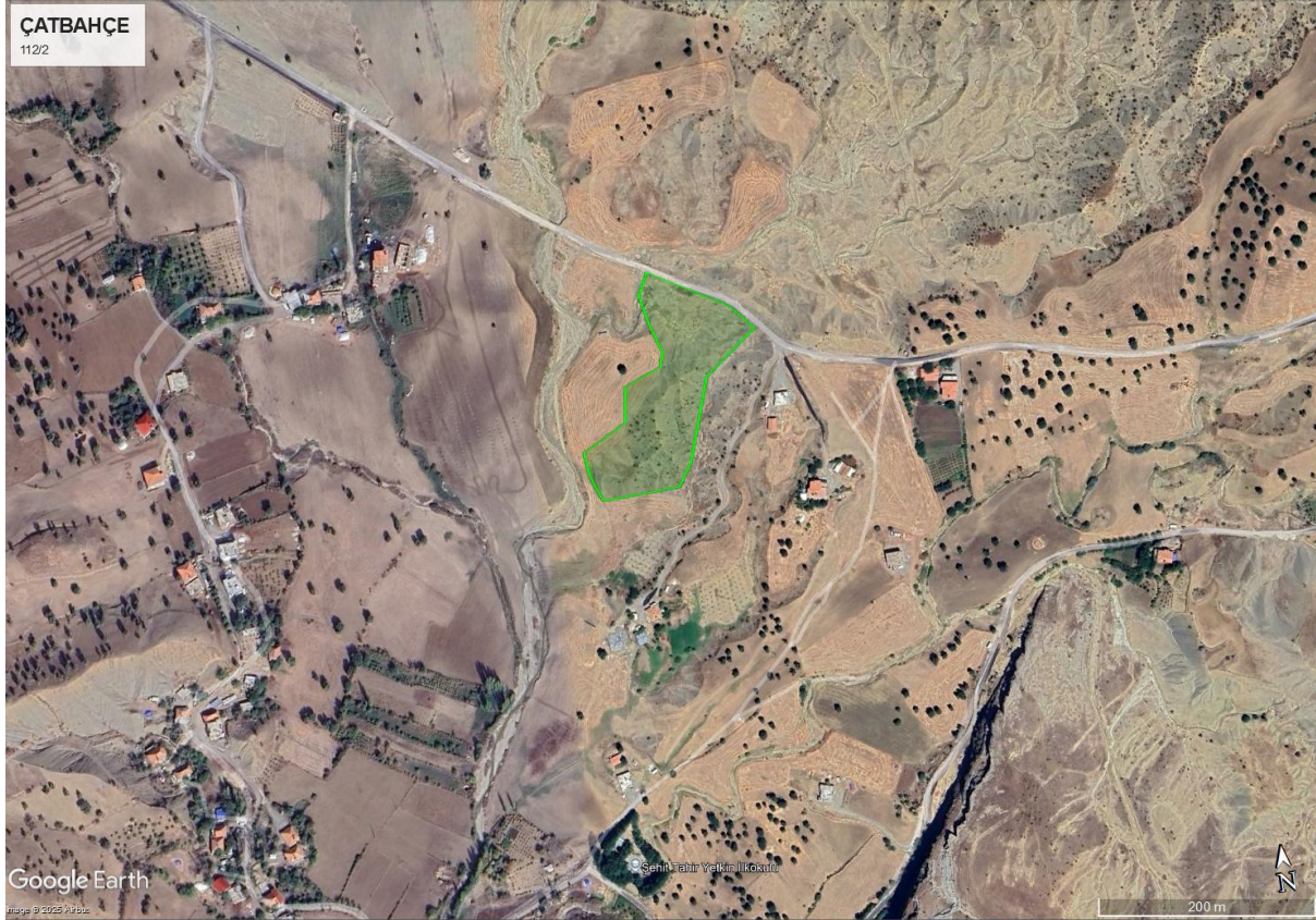
Şekil 1. Çatbahçe Köyü Uydu Görüntüsü (Parsel 112/2 - 5 Kırsal Konut)

Çatbahçe Köyü'ndeki parselin konumu Şekil 1'de uydu görüntüsü üzerinde sunulmaktadır.