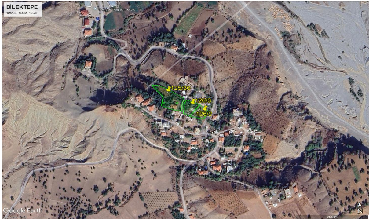
Şekil 3. Dilektepe Köyü Uydu Görüntüsü (3 parsel [Parsel 126/2, 126/3 ve 125/36]-3 Kırsal Konut)

Dilektepe Köyü'ndeki her bir parselin konumu Şekil 3'te uydu görüntüsü üzerinde sunulmaktadır.