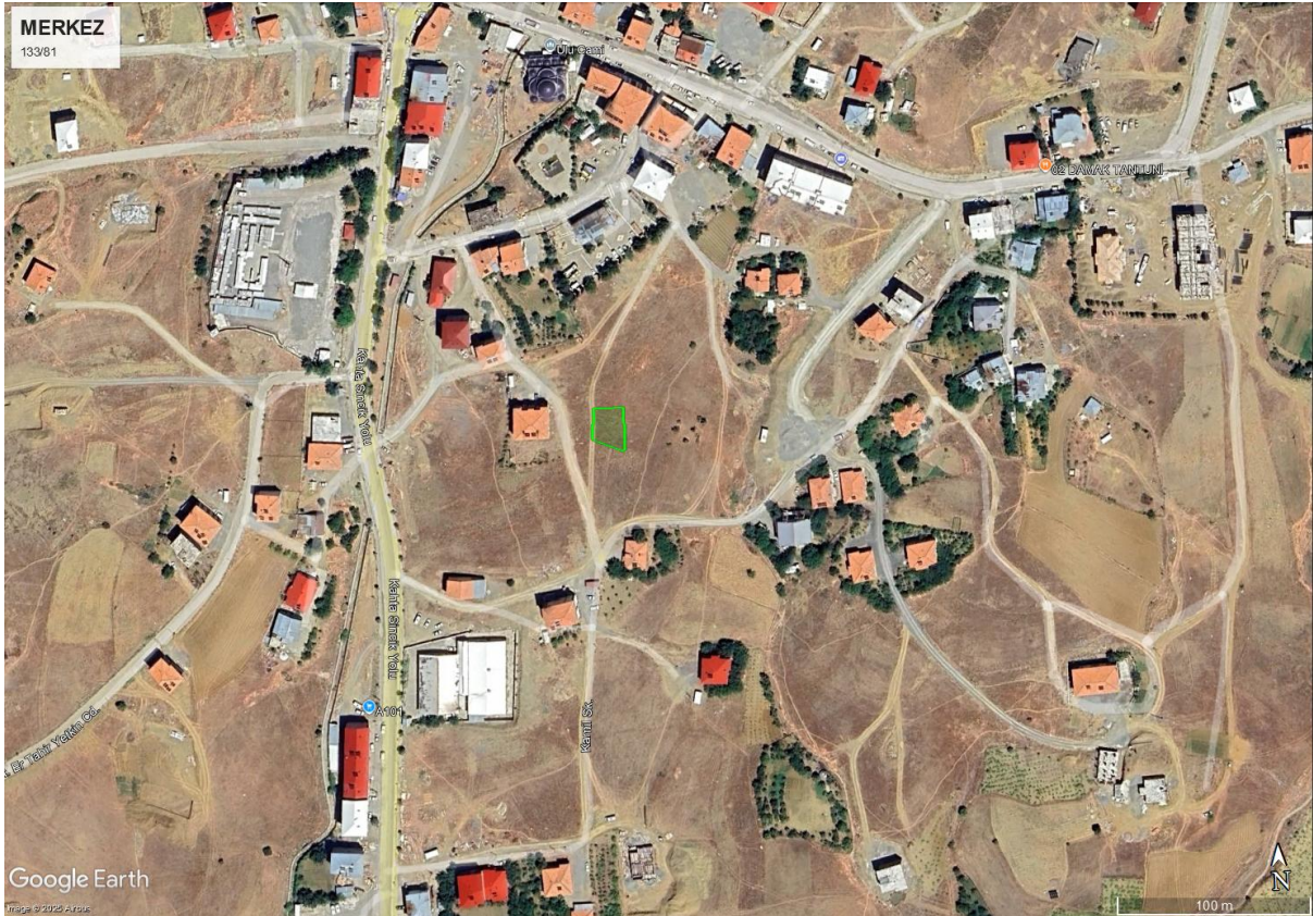
Şekil 2. Merkez Mahallesi Uydu Görüntüsü (Parsel 133/81-1 Kırsal Konut)

Merkez Mahalle'de parselin konumu Şekil 2'de uydu görüntüsü üzerinde sunulmaktadır.