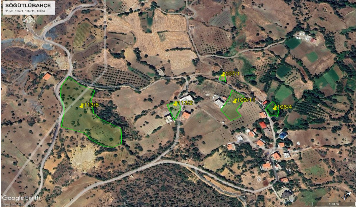
Şekil 4. Söğütlübağçe Köyü Uydur Görüntüsü (Parsel [109/11, 106/4, 107/1, 113/5 ve 113/2]-5 Kırsal Konut)

Söğütlübağçe Köyü'nde bulunan 109/11, 106/4, 107/1, 113/5 ve 113/2 numaralı parsellerin yakın çevresinde yer alan konutlar, yapılar, su kanalı ve kuru dere, Çevresel ve Sosyal Tarama Formu'nun Ek-3'ünde (bu Plan'ın Ek-2'si) gösterilmiş olup, bunlara ilişkin mesafe bilgileri sunulmuştur. Parsellere ait mevcut altyapı bilgileri ise Ek-1'de yer almaktadır.