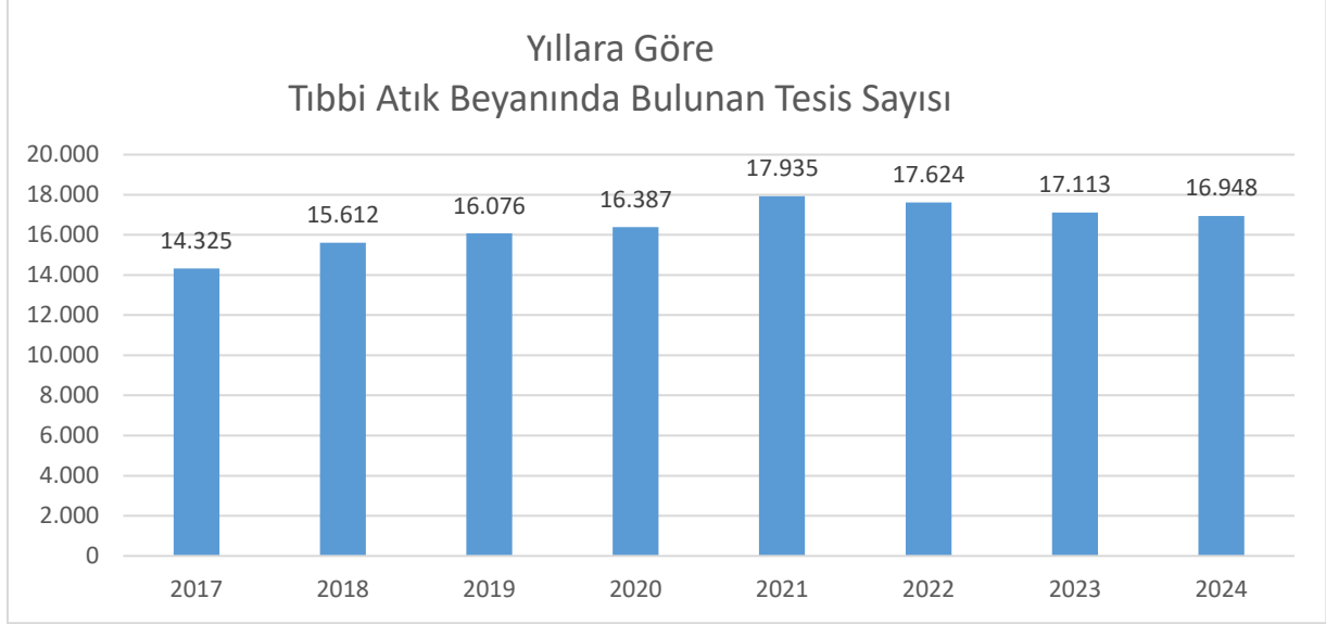
Grafik 2. Yıllara Göre Tıbbi Atık Beyanında Bulunan Tesis Sayısı (Adet)