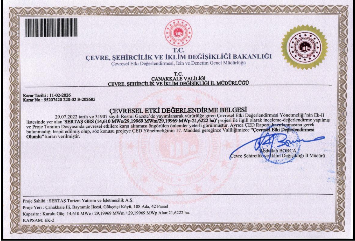
Görsel 3: ÇED Olumlu Belgesi

Çevre Şehircilik ve İklim Değişikliği Bakanlığı, Çevresel Etki Değerlendirmesi İzin ve Denetim Genel Müdürlüğü, Çanakkale İl Müdürlüğü tarafından 11/02/2026 tarihli ve E-202685 sayılı 'ÇED Olumlu Belgesi' bulunmaktadır. ÇED Olumlu Kararının 14,610 MWe / 29,19969 MWm kurulu gücü için geçerli olduğu yine aynı karar ile belirtilmiştir.