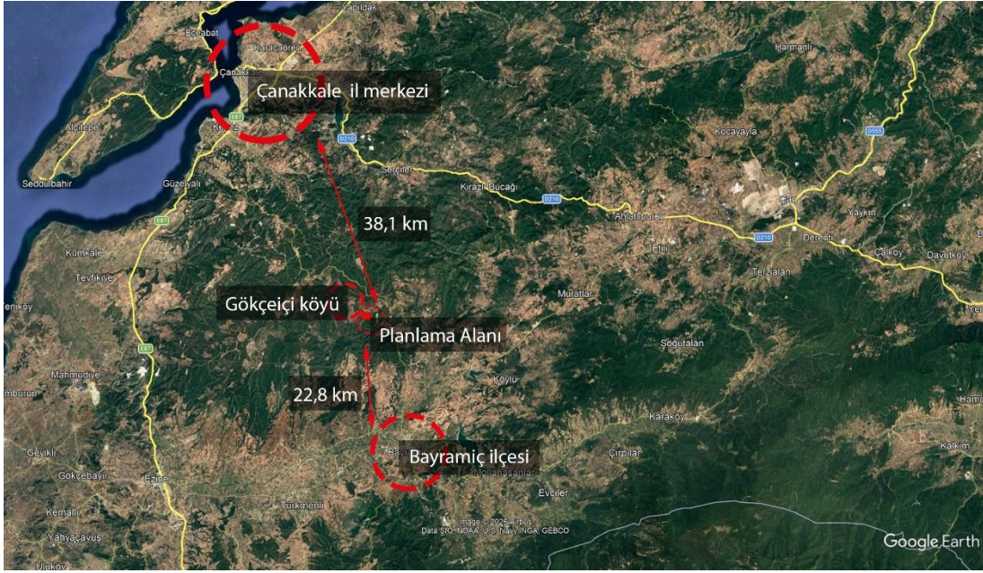
Görsel 1: Planlama Alanının Ulaşım Bağlantısını Gösterir Uydu Görüntüsü

Çanakkale il merkezinin güneydoğu yönünde konumlanan planlama alanı, il merkezine karayolu ile yaklaşık 38,1 km mesafede bulunmaktadır. Bayramiç ilçe merkezinin kuzeybatı doğrultusunda yer alan planlama alanının ilçe merkezine uzaklığı karayolu ile yaklaşık 22,8 km'dir. Planlama alanı, Gökçeici Köyü'ne yaklaşık 1,61 km mesafede konumlanmaktadır. Alana ulaşım, Çanakkale il merkezi üzerinden karayolu bağlantısı ile sağlanmaktadır.