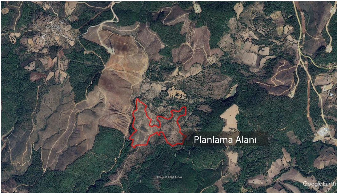
Görsel 2: Planlama Alanını Gösterir Uydu Görüntüsü