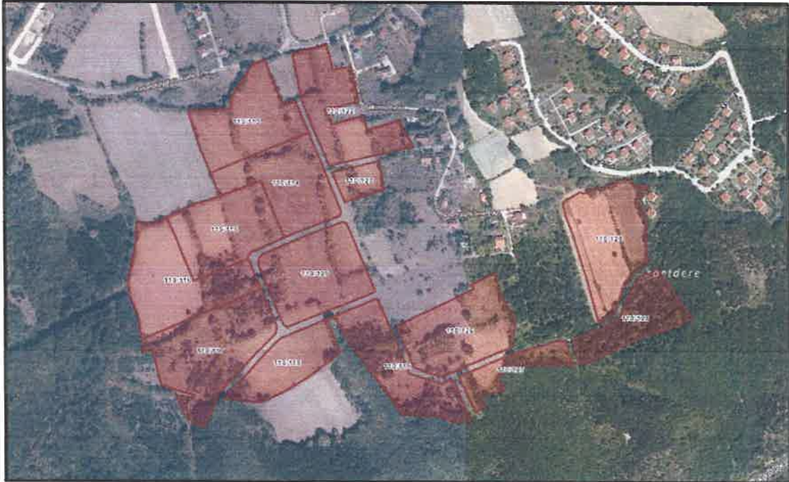
Şekil2:Plan Değişikliğine Konu Alanın Uydur Görüntüsü

Planlamaya konu alanda parseller: Bolu İli, Merkez İlçesi, Avdan Köyü, 110 ada 113 parselin 15.345,00 m 2 (Arsa vafında), 114 parselin 15.141,84 m 2 (Arsa vafında), 115 parselin 15.345,00 m 2 (Arsa vafında), 116 parselin 17.952,62 m 2 -(Arsa vafında), 117 parselin 20.705,14 m 2 (Arsa vafında), 118 parselin 10.077,26 m 2 (Arsa vafında), 119 parselin 13.705,35 m 2 -Arsa vafında, 120 parselin 17.173,95 m 2 -Arsa vafında, 122 parselin 14.165,57 m 2 (Arsa vafında), 123 parselin 3.216,28 m 2 (Arsa vafında), 126 parselin 16.227,70 m 2 (Arsa vafında), 127 parselin 5.708,06 m 2 (Arsa vafında), 128 parselin 10.043,36 m 2 (Arsa vafında), ve 129 parselin 17.259,29 m 2 (Arsa vafında)'dır.