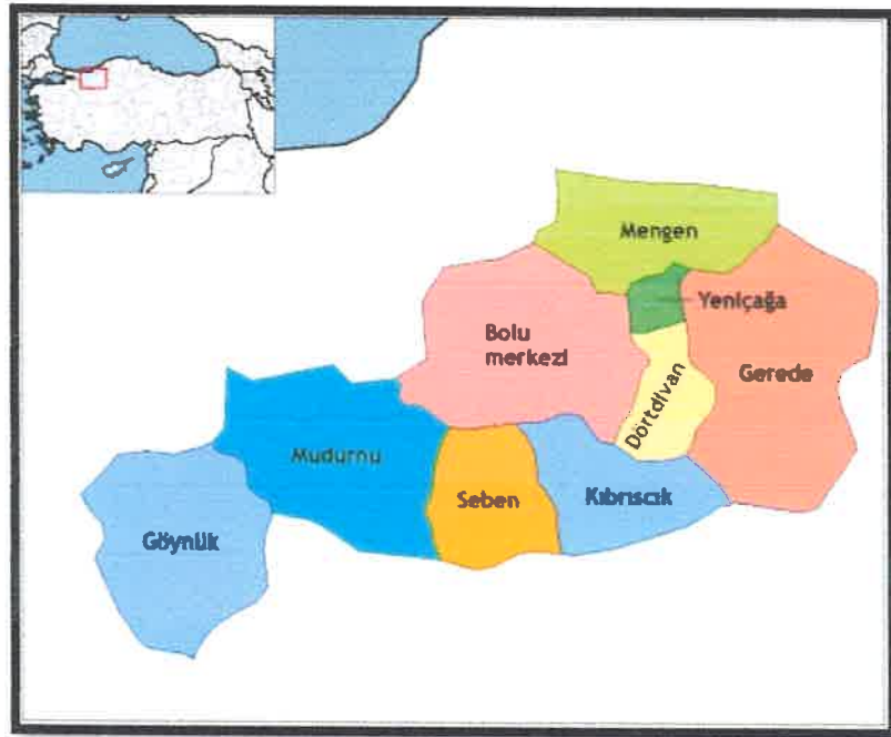
Şekil1: Bolu İl Haritası

Çevre Düzeni Planları dengeli ve sürekli kalkınma amacına uygun olarak ekonomik kararlarla ekolojik kararların bir arada düşünülmesine imkan veren, rasyonel doğal kaynak kullanımını sağlamak üzere kalkınma planları ve varsa bölge planları temel alınarak yapılan ve tarım, turizm, konut, sanayi, ulaşım vb. genel arazi kullanım kararlarını, politika ve stratejilerini belirleyen, bölge veya havza bazında hazırlanan, plan hükümleri ve plan açıklama raporuyla bütün olan üst ölçekli fiziki planlardır. Bolu İli 1/100.000 Ölçekli Çevre Düzeni Planı İl'in yönetsel sınırları ile tanımlanan alanı kapsamaktadır. İl yönetsel sınırları bu planın onay sınırlarıdır. Plan hükümleri, plan sınırları içinde tüm arazi kullanım kararları ile mevcut ve yürürlükte bulunan tüm çevre düzeni planları ile nazım ve uygulama imar planlarının 1/100.000 Çevre Düzeni Planı'na uyarlanma koşullarını belirler.