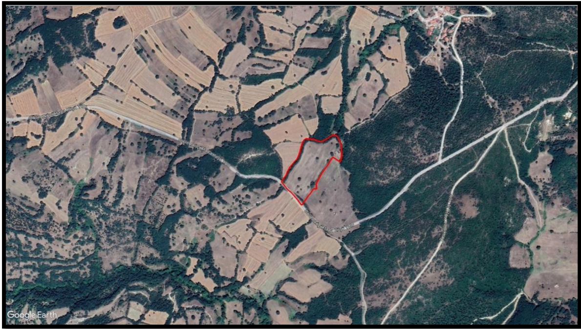
Şekil 2. Planlama Alanı ve Çevresi Uydu Görüntüsü

Söz konusu proje alanı, Balıkesir'in güneybatısında ve Savaştepe İlçesinin de kuzeydoğusunda yer almaktadır.