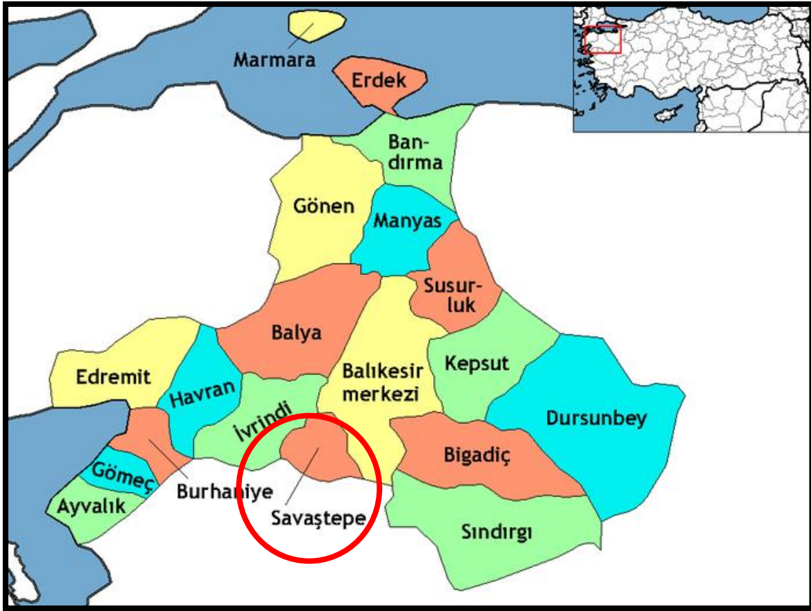
Şekil 1. Projenin Türkiye'deki Yeri

Ayrıca projenin toplam alan büyüklüğü yaklaşık 1,03 hektar büyüklüğündedir.