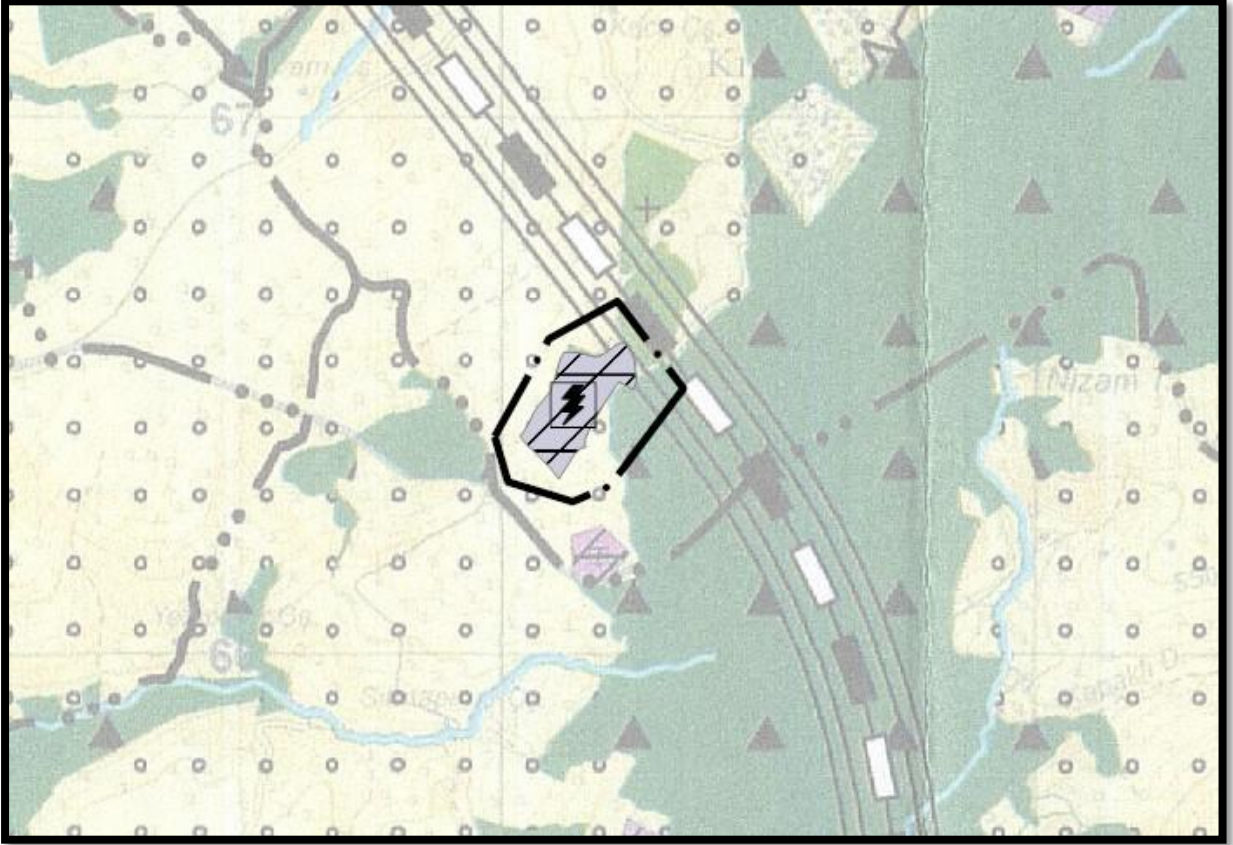
Şekil 10: Öneri 1/25.000 Ölçekli Nazım İmar Planı Değişikliği

Bu kapsamda, planlama alanı içerisinde Enerji Üretim Alanı amaçlı 1 adet türbin için 1/25.000 ölçekli nazım imar planı değişikliği çalışması hazırlanmıştır.