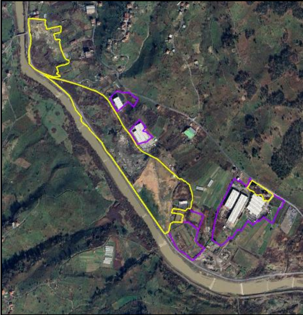
Şekil 1: Plan değişikliğine konu alanın uydu görüntüsü

Plan değişikliğine konu alan; Zonguldak İli, Alaplı İlçesi, Çamlıbel Köyünün güneyinde yer almaktadır.