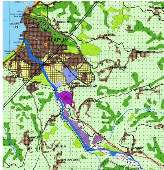
Şekil 4: 1/25.000 ölçekli ÇDP Değişikliği