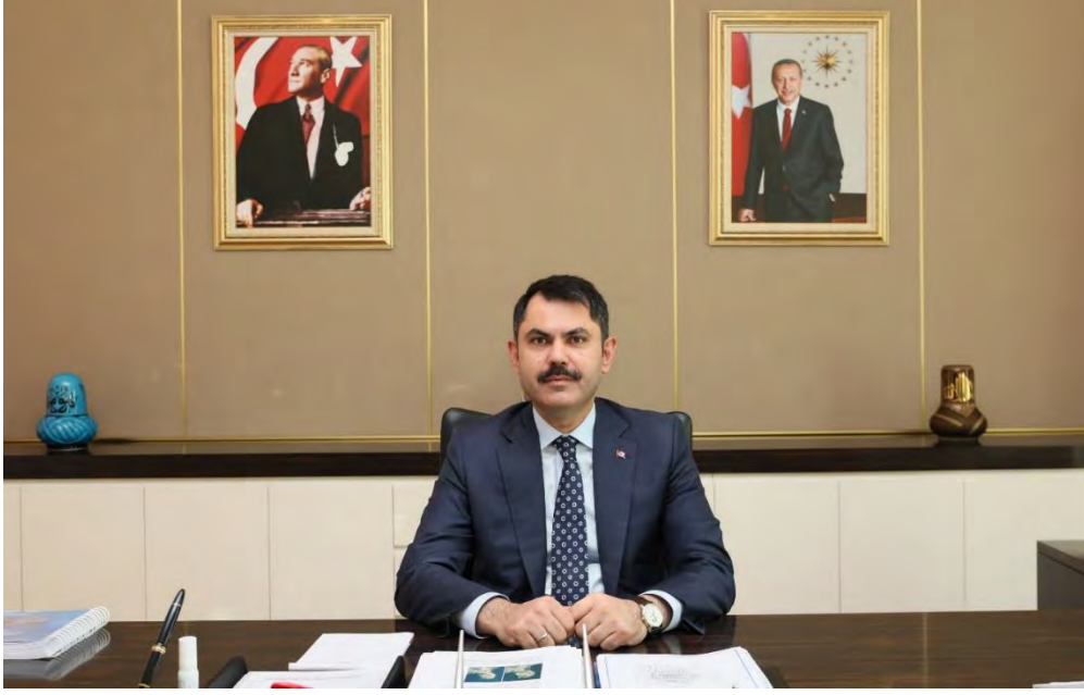
Murat KURUM Türkiye Cumhuriyeti Çevre ve Şehircilik Bakanı

Bakanlığımız; millet bahçelerinden sıfır atık projesine, kentsel dönüşümden sosyal konut üretimine, doğa harikası tabiat varlıklarımızın korunmasından yerel yönetimlerimizin güçlendirilmesine kadar çevre ve şehircilik konularında çok geniş bir sorumluluk alanına sahiptir.