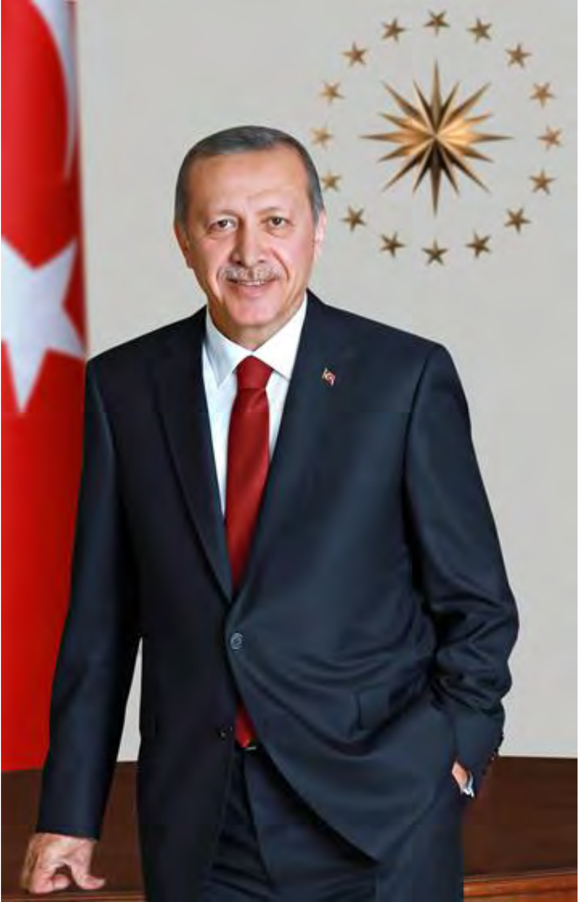
Recep Tayyip ERDOĞAN Türkiye Cumhuriyeti Cumhurbaşkanı