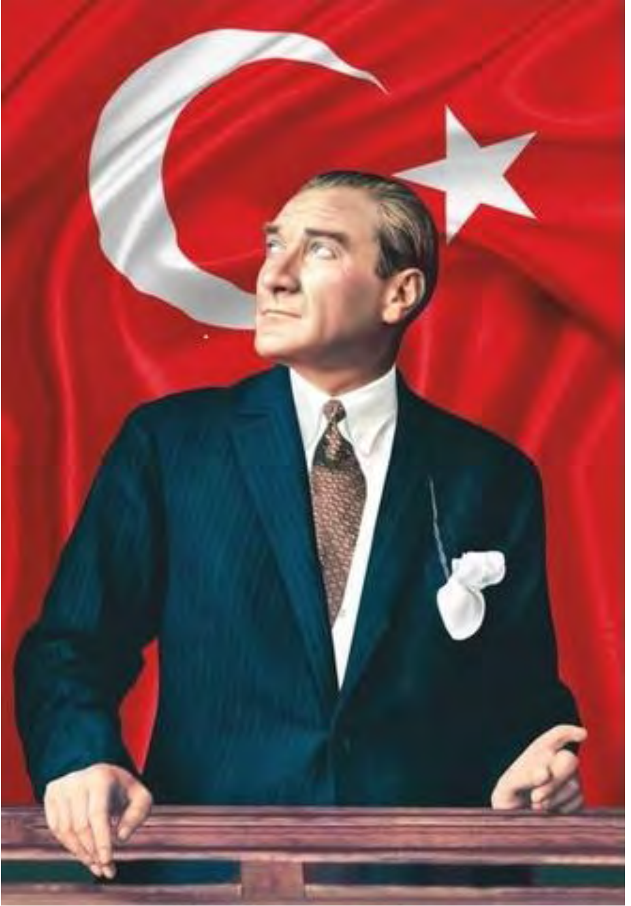
Mustafa Kemal ATATÜRK Türkiye Cumhuriyetinin Kurucusu