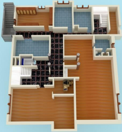
BODRUM KAT PLANI