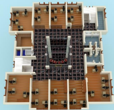
3.NORMAL KAT PLANI