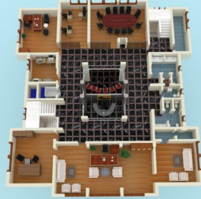
1.NORMAL KAT PLANI