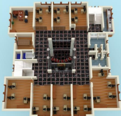
2.NORMAL KAT PLANI