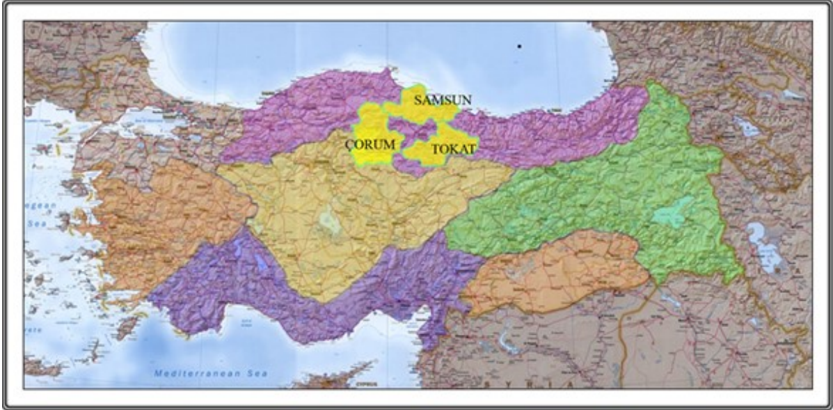
Şekil 1: Samsun-Çorum-Tokat Planlama Bölgesi

Samsun-Çorum-Tokat Planlama Bölgesi 1/100.000 Ölçekli Çevre Düzeni Planı Samsun, Çorum, Tokat il sınırları içinde, planın amacına yönelik mekânsal kararlar, politika ve stratejileri içermektedir. İllerin yönetsel sınırları bu planın onay sınırlarıdır. Planlama Bölgesi toplam 37.762 km 2 'lik bir alanı kapsamaktadır.