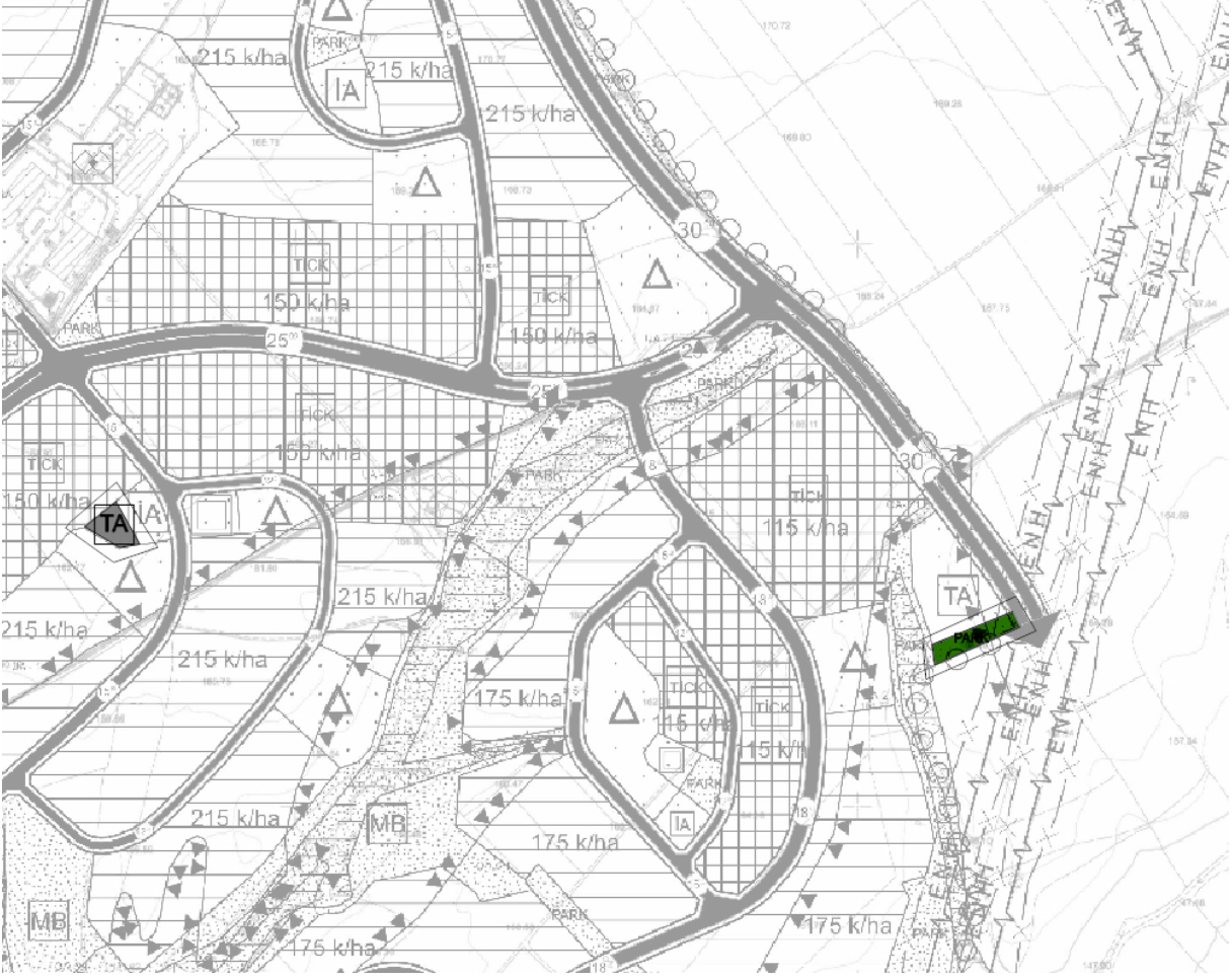
Öneri 1/5000 Uygulama İmar Planı

Sosyal konut uygulamaları kapsamında devam eden 760 konutluk proje kapsamında ihtiyaç duyulan doğalgaz tesisinin yapılabilmesi için yaklaşık 900m 2 lik Park alanının tamamı teknik altyapı alanı olarak ayrılmaktadır.