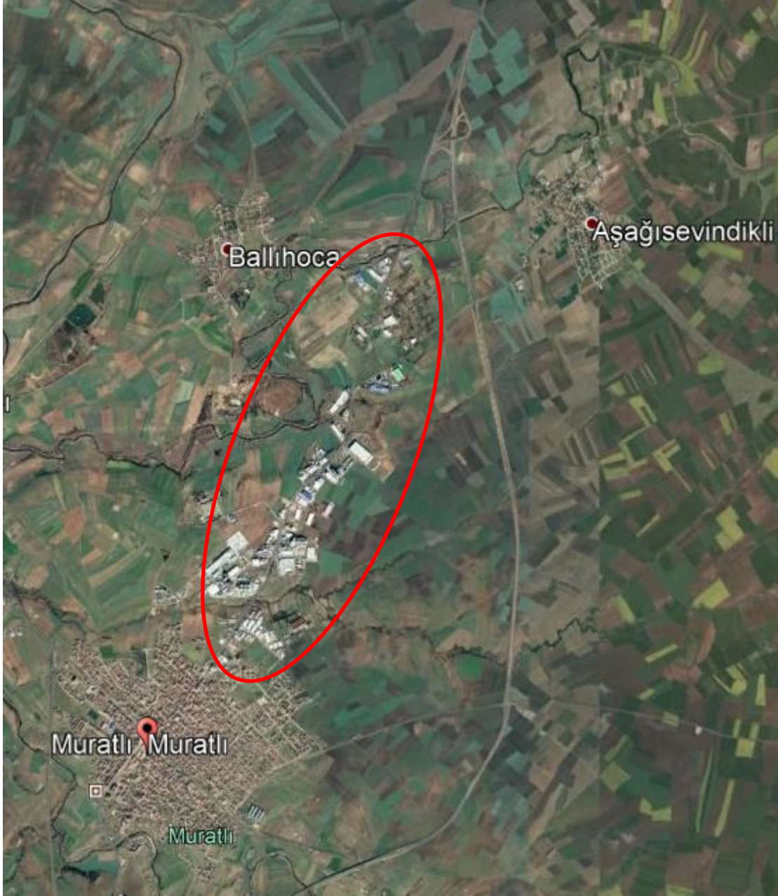
Şekil 1. Planlama Alanının Konumu (Uydu Görüntüsü)

Planlama alanının eğimi %1-2 civarında, hakim rüzgar yönü kuzeydoğu olup 3. derece deprem bölgesindedir. Alanda sit alanı bulunmamaktadır.