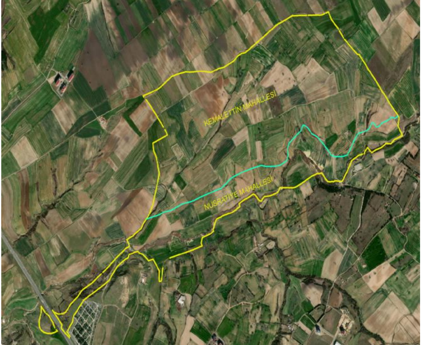
-Uygulama Alanı Genel Görünüm

Parselasyon Planı Açıklama Raporuna konu iş; 'Tekirdağ İli, Çorlu İlçesi, Kemalettin ve Nusratiye Mahallelerinde bulunan Yaklaşık 215 Hektarlık Alana İlişkin, 3194 sayılı kanunun 18.maddesinin uygulaması işlemidir. Uygulamanın tamamı yapılaşmanın bulunmadığı boş parsellerden oluşmaktadır.