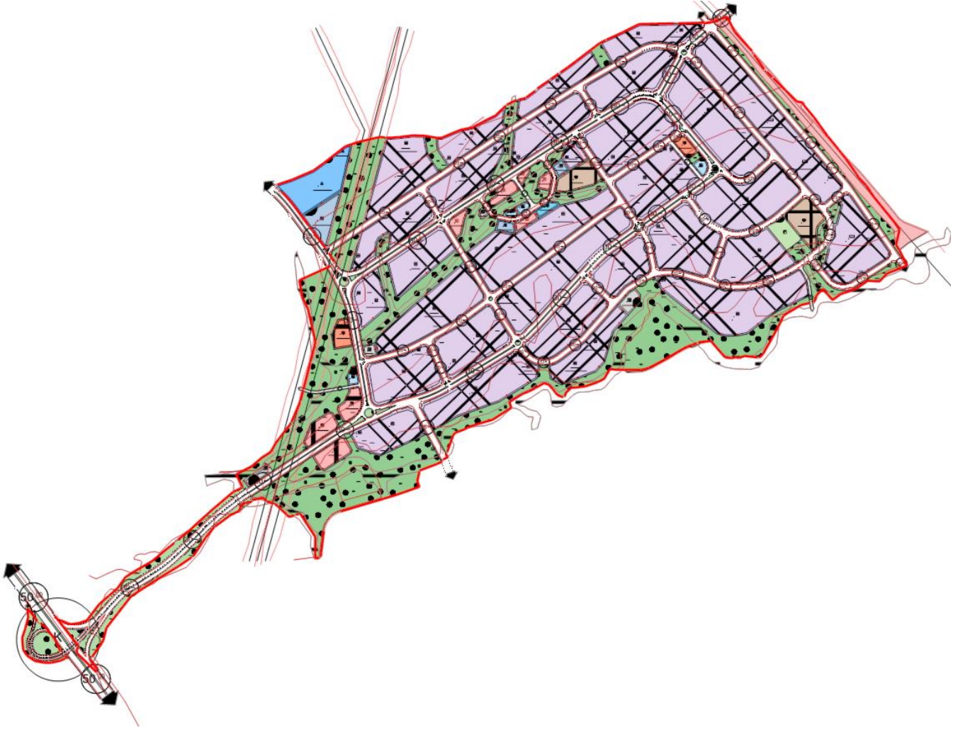
Uygulama Alanı Plan Görüntüsü

Uygulamanın dayanağı olan her iki imar planının da 1/1000 Ölçekli Uygulama İmar Planı ve Plan Notları onaylı örneği raporun ekindedir.