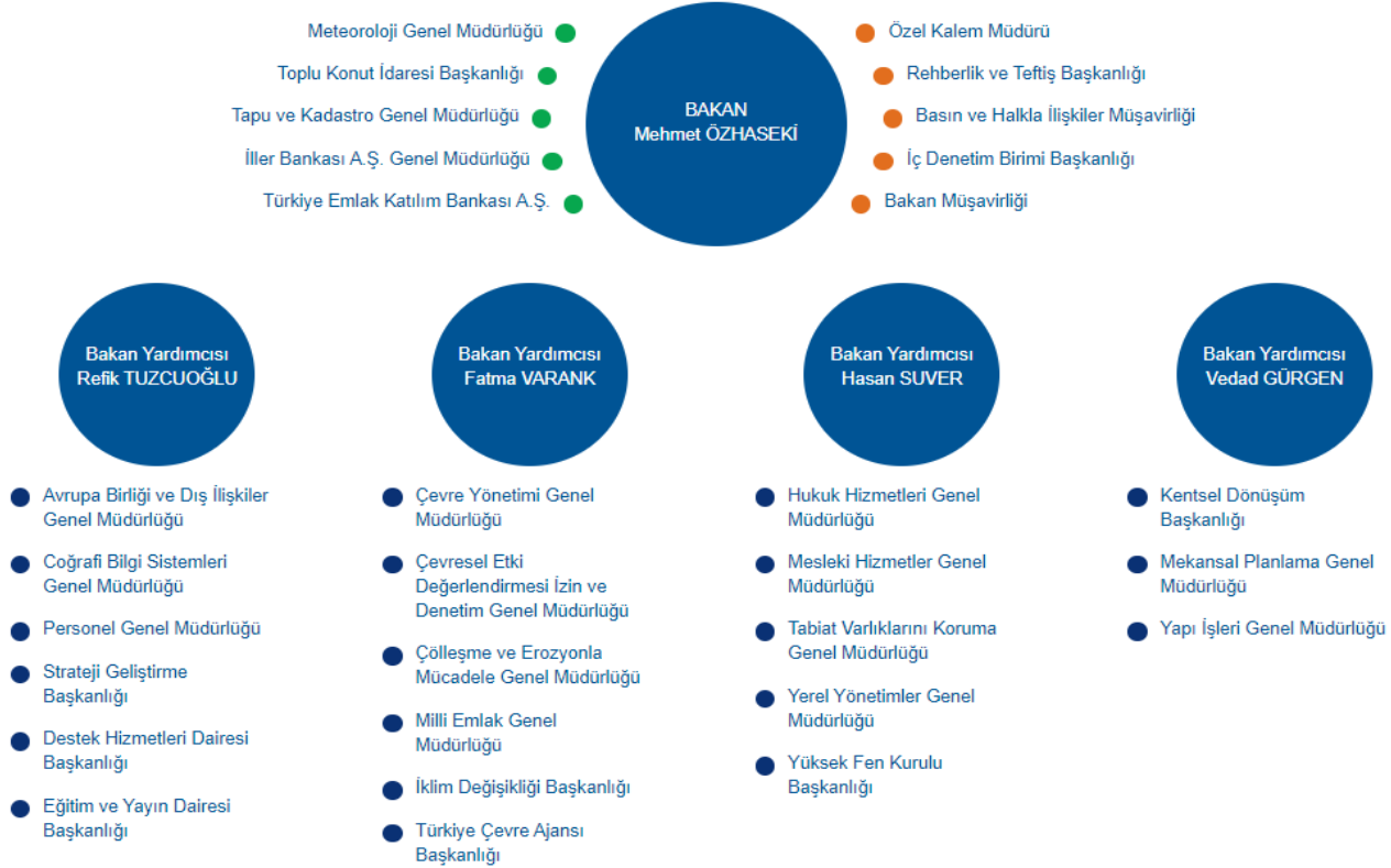
Şekil 1. Çevre, Şehircilik ve İklim Değişikliği Bakanlığı Teşkilat Şeması