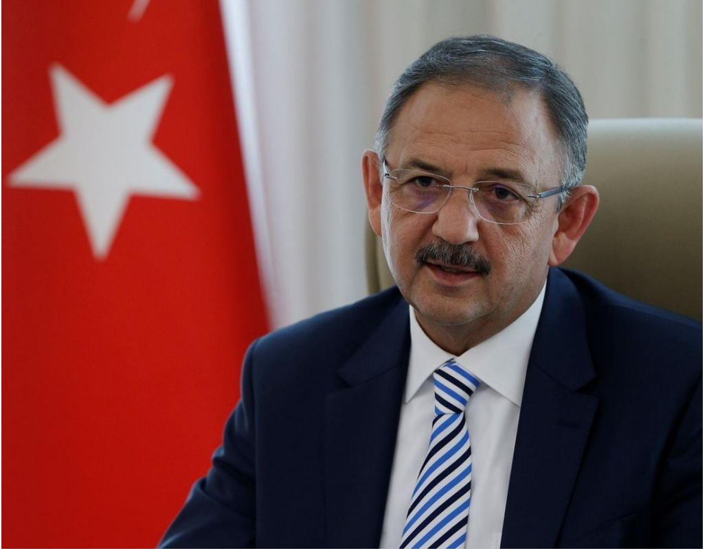
Mehmet ÖZHASEKİ Çevre, Şehircilik ve İklim Değişikliği Bakanı