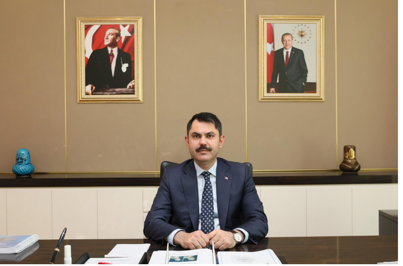
Murat KURUM Çevre ve Şehircilik Bakanı

“Sürdürülebilir Çevre, Medeniyetimizi Yaşatan Şehirler” vizyonuyla çevre ve şehircilik alanında geniş bir görev ve sorumluluk üstlenmiş olan Bakanlığımız; şehirlerimizin mekân kalitesi yüksek, üstyapısı yeterli, altyapısı sağlam ve çevreye duyarlı bir biçimde gelişmesi için çalışmalarını sürdürmektedir.