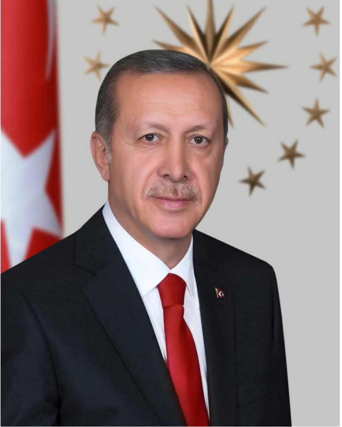
RECEP TAYYİP ERDOĞAN