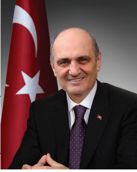
Erdoğan BAYRAKTAR Çevre ve Şehircilik Bakanı