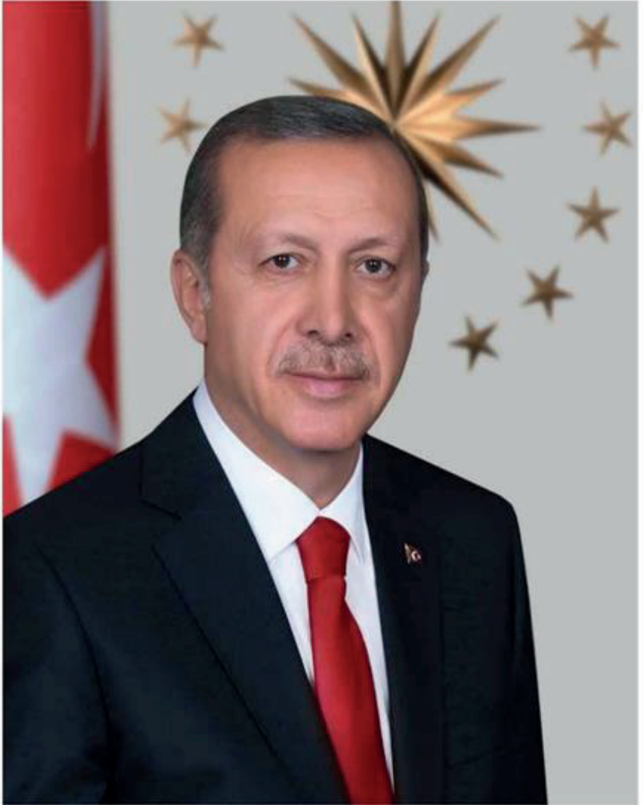
Recep Tayyip ERDOĞAN Türkiye Cumhuriyeti Cumhurbaşkanı