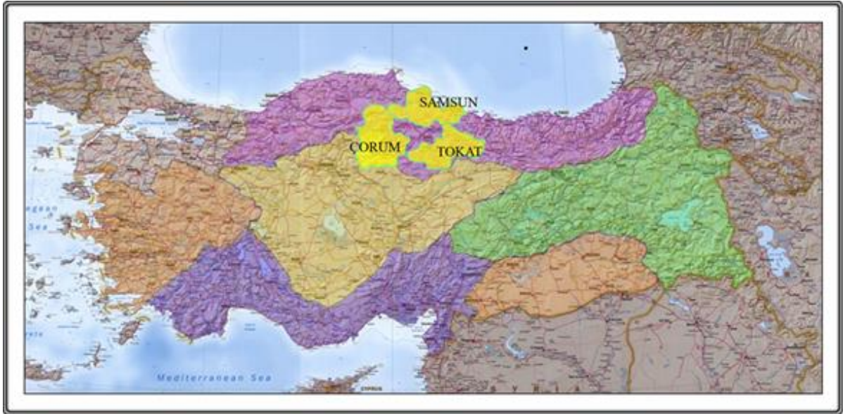
Şekil 1: Samsun-Çorum-Tokat Planlama Bölgesi

Samsun-Çorum-Tokat Planlama Bölgesi 1/100.000 Ölçekli Çevre Düzeni Planı Samsun, Çorum, Tokat il sınırları içinde, planın amacına yönelik mekânsal kararlar, politika ve stratejileri içermektedir. İllerin yönetsel sınırları bu planın onay sınırlarıdır. Planlama Bölgesi toplam 37.762 km 2 'lik bir alanı kapsamaktadır.