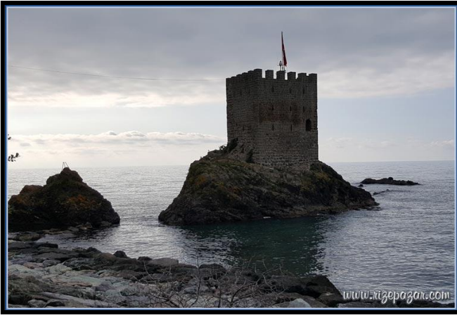
Resim 2: Soğuksu mahallesindeki tescilli yapı; Kız Kulesi(Kalesi)

tescillediği Soğuksu mahallesindeki Kız Kulesi(Kalesi) kıyıda olması itibari ile planlama alanına 2700 m. mesafede yer almaktadır. ( Bkz. Harita 12: Planlama alanının yakın çevresi kıyıdaki tescilli yapılar)