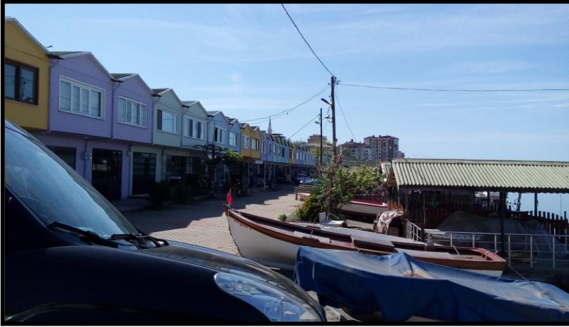
Resim 2: Planlama alanındaki barınak yapıları, 2016

Planlama alanı, 1993 yılında yapılan mevcut imar planında, Kirazlık Balıkçı Barınağı olarak görünmektedir. Ancak, alanın uygulaması, 2004 yılında Ulaştırma Bakanlığı Demiryolları, Limanlar ve Hava Meydanları İnşaatı Genel Müdürlüğü'nün hazırladığı, Balıkçı Barınağı İnşaatı Gelişim Projesi Vaziyet Planındaki şekliyle yapılmıştır. (Bkz. Harita 20: DLH Genel Müdürlüğü'nün hazırladığı Balıkçı Barınağı İnşaatı Gelişim Projesi Vaziyet Planı, 2004)