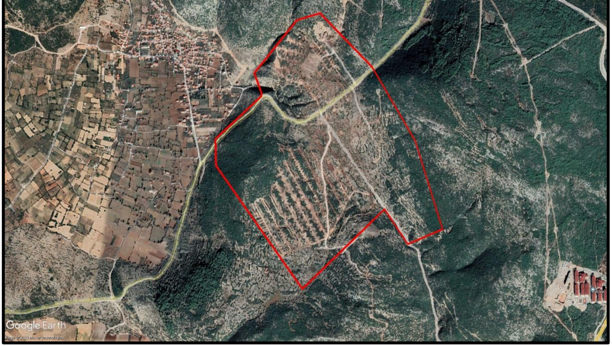
Harita 6. Muğla İli, Mentеше İlçesi, Akkaya Mahallesi, Yeni Küçük Sanayi Sitesi Sınırı

Planlama alanının kuzeydoğusunda, kent merkezinin güneydoğusunda mevcut küçük sanayi sitesi bulunmakta ve faal olarak işlemektedir. Planlama sınırı yaklaşık olarak 153 ha. olup ayrıntılı uydu görüntüsü aşağıda verilmiştir.