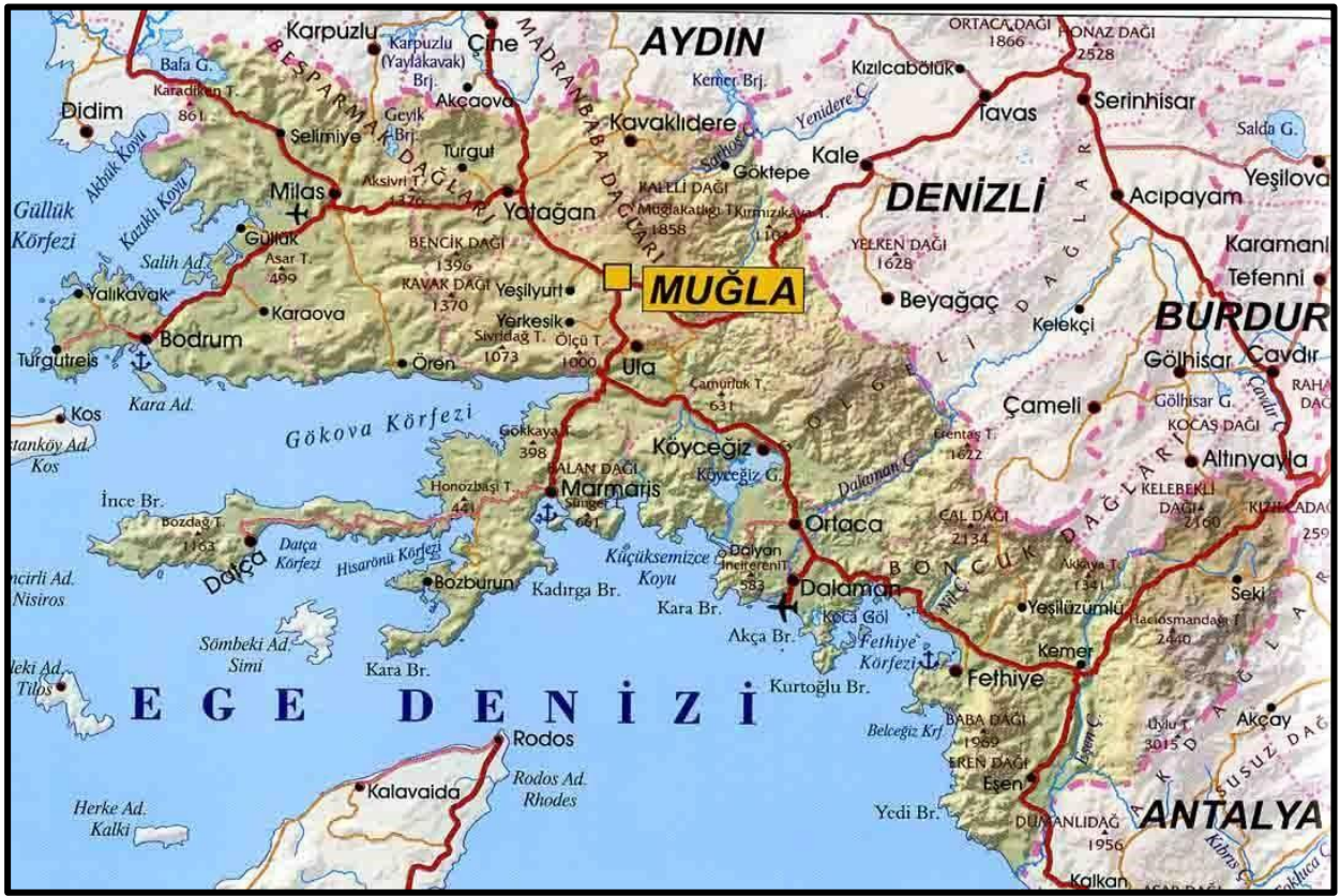
Harita 2. Muğla İli'nin Coğrafi Haritası

Muğla'da yabancı hayvan varlığı oldukça çeşitli ve zengindir. Marmaris Adaköy'de alageyik, Marmaris Karadağ yarımadası, Yılanlı Çakmak Kocatepe ve Köyceğiz'de ise yaban keçisi üretme ve koruma sahaları bulunmaktadır. Dünyada az rastlanan "Caretta Caretta" cinsi iri deniz kaplumbağası Dalyan - İztuzu üreme sahasında kontrol ve koruma altındadır. Muğla İli, bıldırcın, keklik, leylek, kırlangıç, şahin, serçe, yaban kazı gibi kanatlı ve yaban keçisi, alageyik, kurt, çakal, tilki, tavşan gibi zengin bir memeli yabancı hayvan varlığına sahiptir.