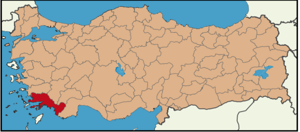
Harita 1. Muğla İli'nin Ülkedeki Konumu

Muğla İli'nin batı ve güney kesimleri Ege Denizi'ne açılmaktayken, kuzeyinde Aydın, kuzeydoğusunda Denizli ve Burdur, doğusunda ise Antalya İli bulunmaktadır. Toplam uzunluğu 1.479 km. olan deniz kıyıları ile Muğla, Türkiye'nin en uzun sahil şeridine sahip ildir.