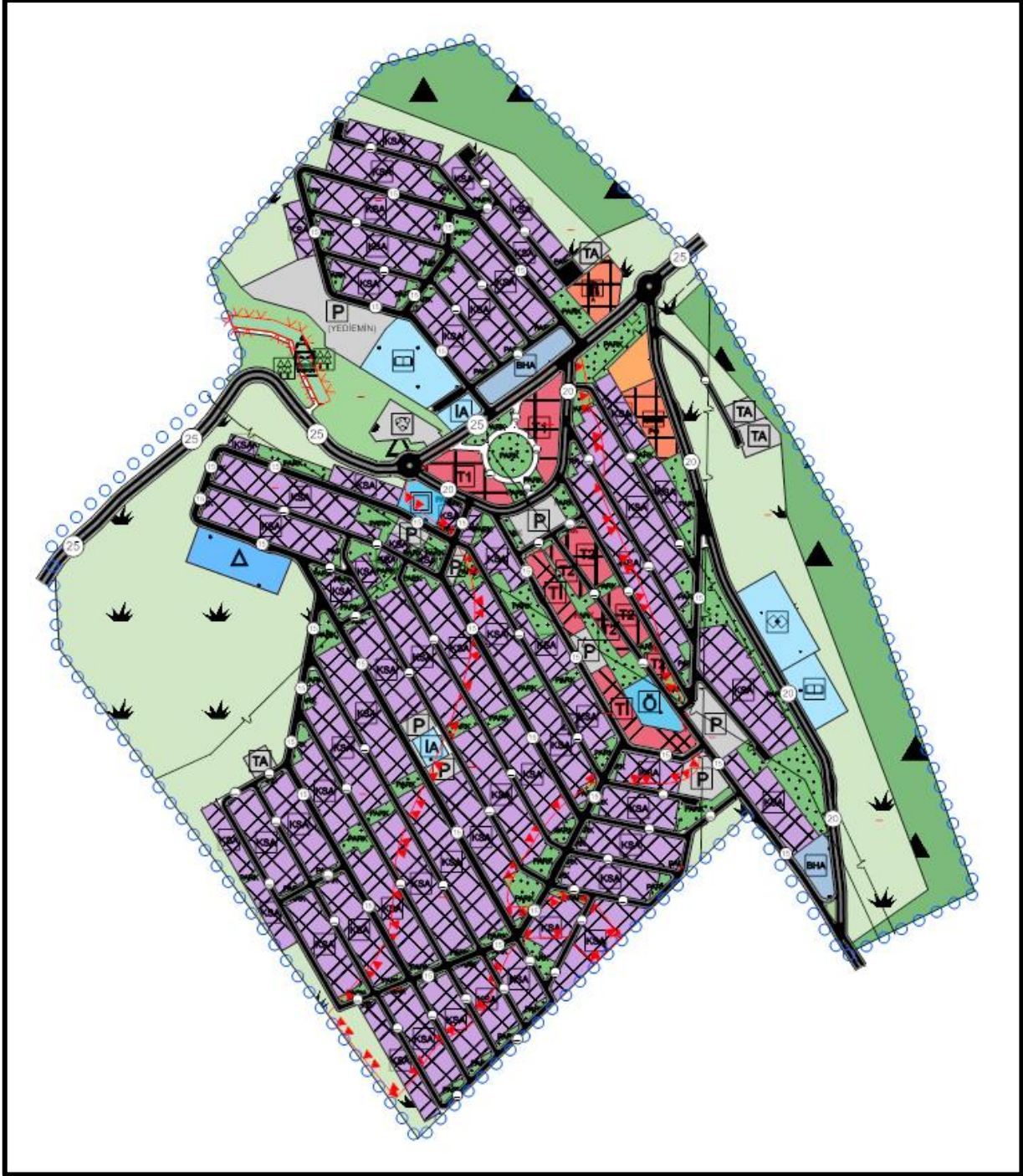
Harita 9. Muğla İli Mentеше İlçesi Akkaya Mahallesi Ata Küçük Sanayi Sitesi 1/5.000 Ölçekli Nazım İmar Planı Teklifi