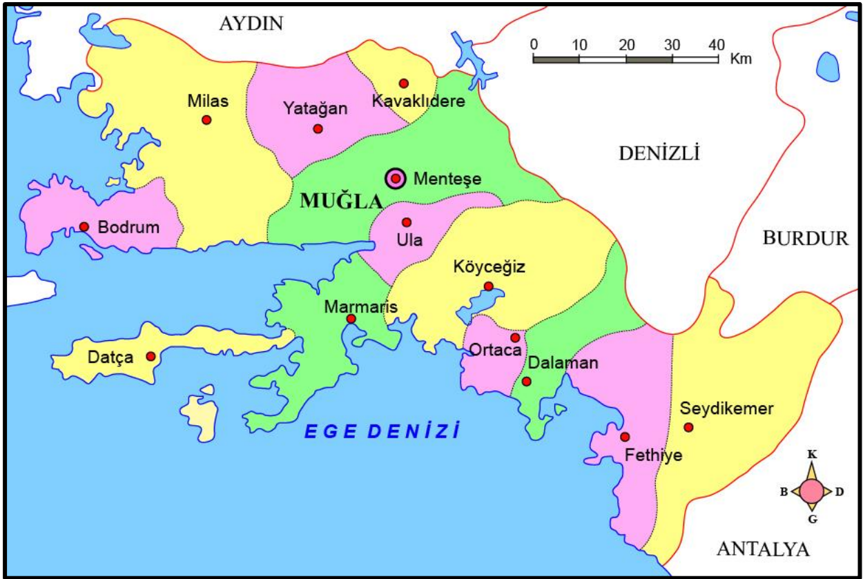
Harita 3. Muğla İli'nin İdari Bölünüşü

118.443 nüfusa sahip olan Mentеше İlçesi 1.659 km 2 büyüklüğündedir. Diğer 12 ilçe ile birlikte değerlendirildiğinde ilin en yüksek nüfusa sahip 4. ilçesidir. İlçede 66 mahalle bulunmaktadır.