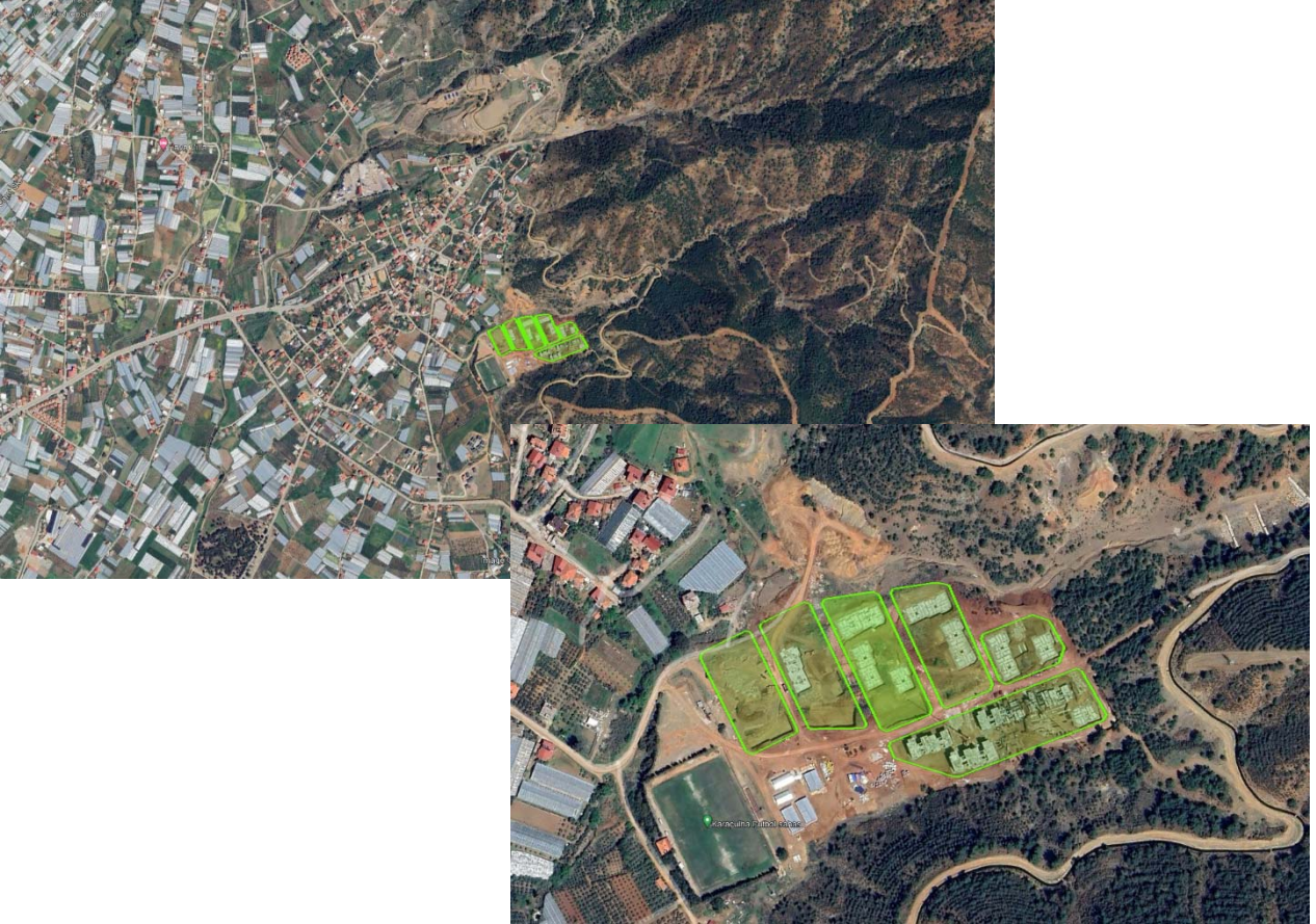
Şekil 1: Planlama Alanı Genel Konumu

Fethiye ilçe merkezine 15 kilometre uzaklıkta bulunan Karaçulha Mahallesi özellikle son yıllarda önemli bir gelişim süreci içerisine girmiştir. Fethiye ilçe merkezinde planlı alanların Kentsel Gelişme Alanı ve Yerleşik Konut Alanı olarak planlı alanların doluluk oranı % 90'ın üzerine ulaşmıştır. Fethiye ilçesinin batısında, güneyinde ve kuzeyinde yer alan eşiklerden dolayı kentin gelişme aksı doğu yönünde oluşmaya başlamıştır. Fethiye ilçe merkezine bitişik konumda olan ve yine 6360 sayılı kanunla Fethiye'ye bağlı bir mahalle konumuna gelen Karaçulha ve Çamköy Mahallesi cazip konuma gelmiştir.